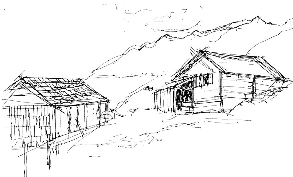
Der Mittelsäss Fadur, Hauptsitz der Kuhalp auf 1839 m ü.M. Der jetzige Schermen stammt aus dem Jahr 1862.

Alle Zeichnungen von Christian Gerber-Albietz