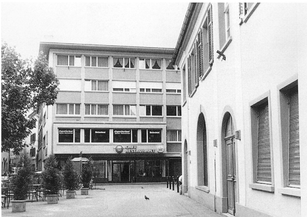
Abb. 15: Kornplatz Nr. 12, heutige Aufnahme.