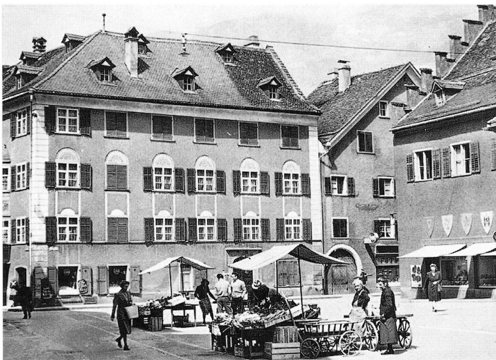
Abb. 14: Kornplatz Nr. 12, historische Aufnahme.

Zusammenfassend lässt sich festhalten, dass die Bauten, die den Kornplatz säumen, in unterschiedlichem Grad einen Wandel vollzogen haben. An der südlichen Platzfront ist im 20. Jahrhundert eindeutig eine Purifizierung der Fassaden des 19. Jahrhunderts festzustellen, wobei spätmittelalterliche Elemente beibehalten werden. Die stärksten Eingriffe betreffen jeweils das Erdgeschoss – eine Konsequenz aus der