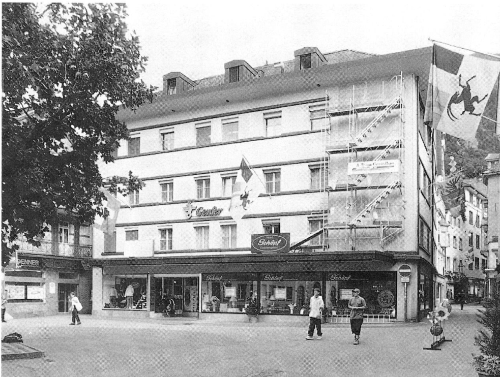
Abb. 9: Kornplatz Nr. 2, heutige Aufnahme. Das Wandbild von Carigiet ist zur Zeit in Restaurierung.

Der in der Nordostecke des Kornplatzes platzierte, leicht zurückversetzte, ehemalige Industriebau wurde um 1900 errichtet. Entsprechend der Zweckbestimmung – im Erdgeschoss war eine Druckerei untergebracht – wurde das dreigeschossige Gebäude in Sichtbackstein