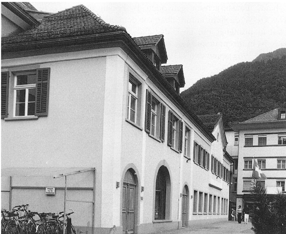
Abb. 13: Kornplatz Nr. 10, heutige Aufnahme.

Die nördliche Platzfront des Kornplatzes bildete ehemals der Südflügel des Nicolaiklosters mit Kirche und Chor, später im Westen das Kornhaus, daran anschliessend bis zum Chorbogen das Reishaus. Im Obergeschoss liegen noch heute die zwei Stuben der Pfisterzunft. Nach 1827 wurde unmittelbar vor dem Chor ein neuer Trakt errichtet. Dieser nimmt auf der Südseite die Flucht des alten Reishaus-Vorbaus auf und reicht gegen Osten bis zum Abschluss des Chores. Von diesem biedermeierlich-klassizistischen Bau ist der Mittelrisalit mit Giebel zwar noch sichtbar, führt aber nicht mehr bis ins Erdgeschoss. Bei der heutigen Nutzung des Erdgeschosses mit Büros der Polizei bestehen gegen den Kornplatz hin in diesem Trakt keine Eingänge mehr, was typologisch gesehen falsch ist. Früher befanden sich hier die Wachtstuben für die Feuerwehr und den Nachtwächter. Im links anschliessenden Teil, dem ehemaligen Reishaus, ist das Mittelportal, noch ersichtlich am Rundbogen, ebenfalls seiner Funktion enthoben. Immerhin dienen die zwei flankierenden Rundbogentore als Eingang zur Pfisterzunft mit dem Standesamt und als Personaleingang der Polizei.