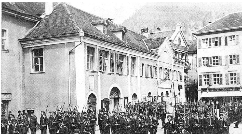
Abb. 12: Kornplatz Nr. 10, historische Aufnahme.