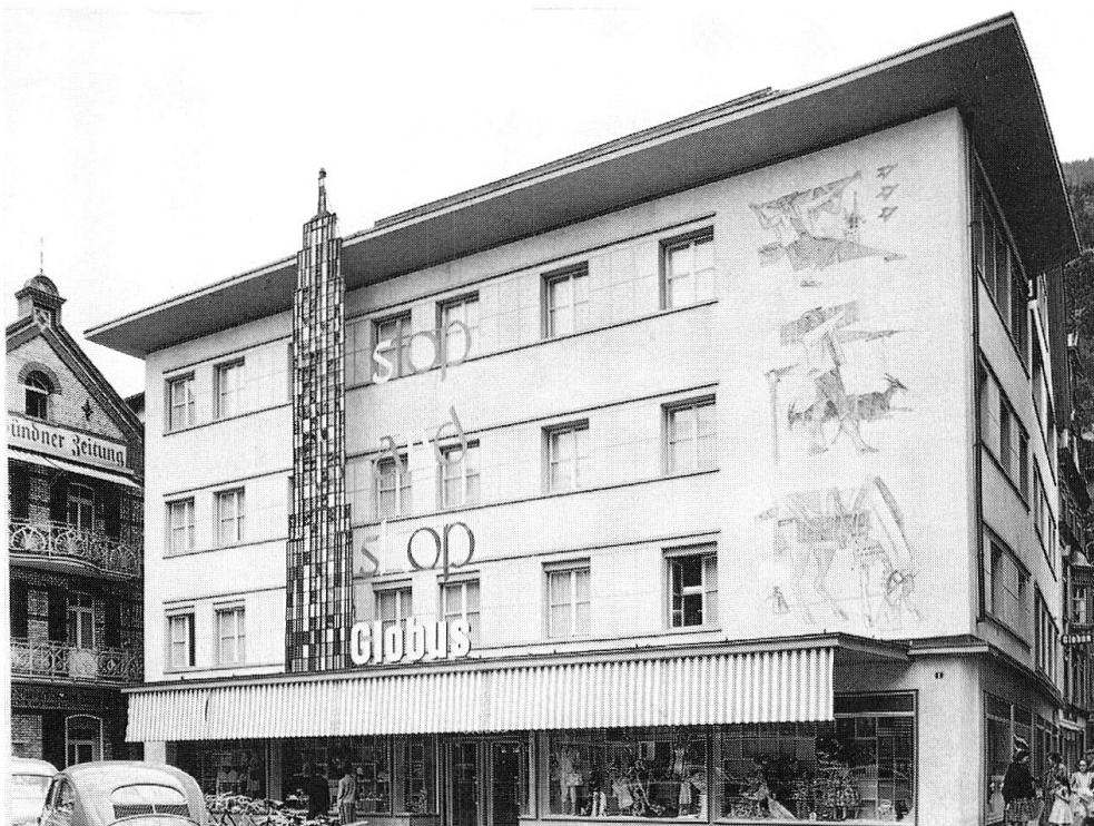
Abb. 8: Kornplatz Nr. 2, 1956 (Foto Archiv Globus).

Das Geschäftshaus der Genfer Versicherungen am Kornplatz 2 erscheint heute in der Form der fünfziger Jahre, der letzten markanten Umbauphase. Das Gebäude stammt in seiner Substanz jedoch aus dem 19. Jahrhundert, was bei genauem Hinsehen in der Rhythmisierung der Fenster noch ablesbar ist. Die linke Haushälfte zeigt die ursprüngliche Fenstergliederung des ehemaligen Gasthofes zum Roten Löwen. 1931 erfolgte ein Umbau des Kaufhauses Globus im Stile der dreissiger Jahre durch die Gebrüder Sulser. Die vertikale Gliederung mit Pilastern wurde zugunsten einer horizontalen Fassadengliederung aufgehoben und das Dach zu einem einheitlichen Walmdach zusammengefasst. Das Haus wurde ausgehöhlt, Fassade und Fensterrhythmus behielt man jedoch bei. 25 Jahre später erfolgte wieder ein zeitgemässes Re-Design der Fassade. Zulasten einer Fensterachse, welche zugemauert wurde, entstand das über drei Geschosse führende Wandbild von Alois Carigiet. Gleichzeitig wurden die heute noch bestehenden Fenster einge-