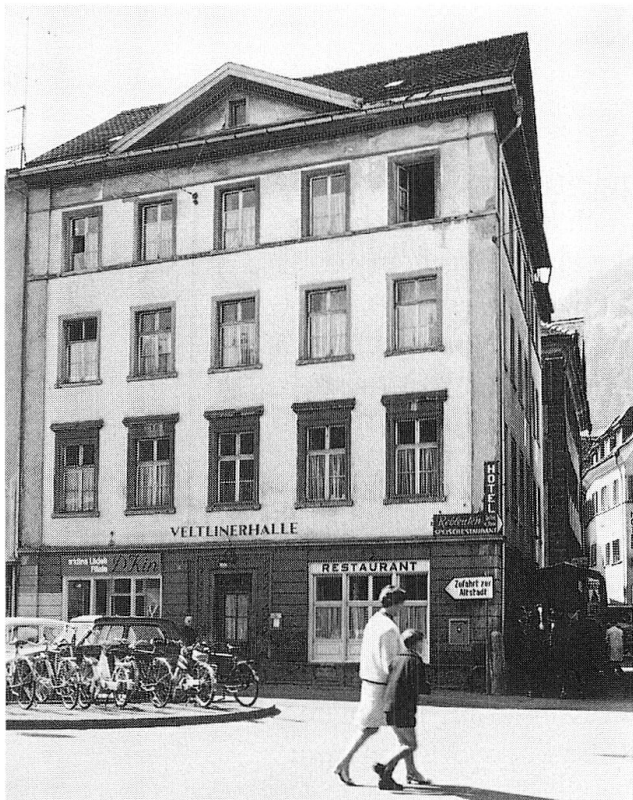
Abb. 3 unten rechts: Kornplatz Nr. 11, heutige Aufnahme.