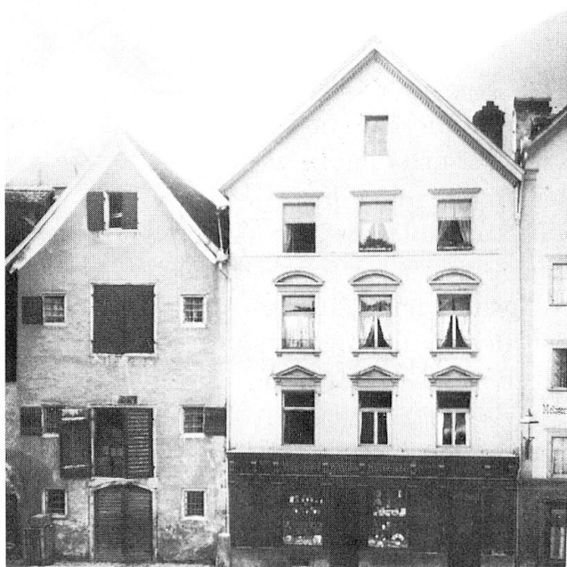
Abb. 7 unten rechts: Kornplatz 1 und 3, heutige Aufnahme.

Abb. 6 unten links: Kornplatz Nr. 1 und 3, historische Aufnahme aus: Peter Metz/Heinrich Jecklin, Chur einst und heute, Chur 1982, S. 114 unten).