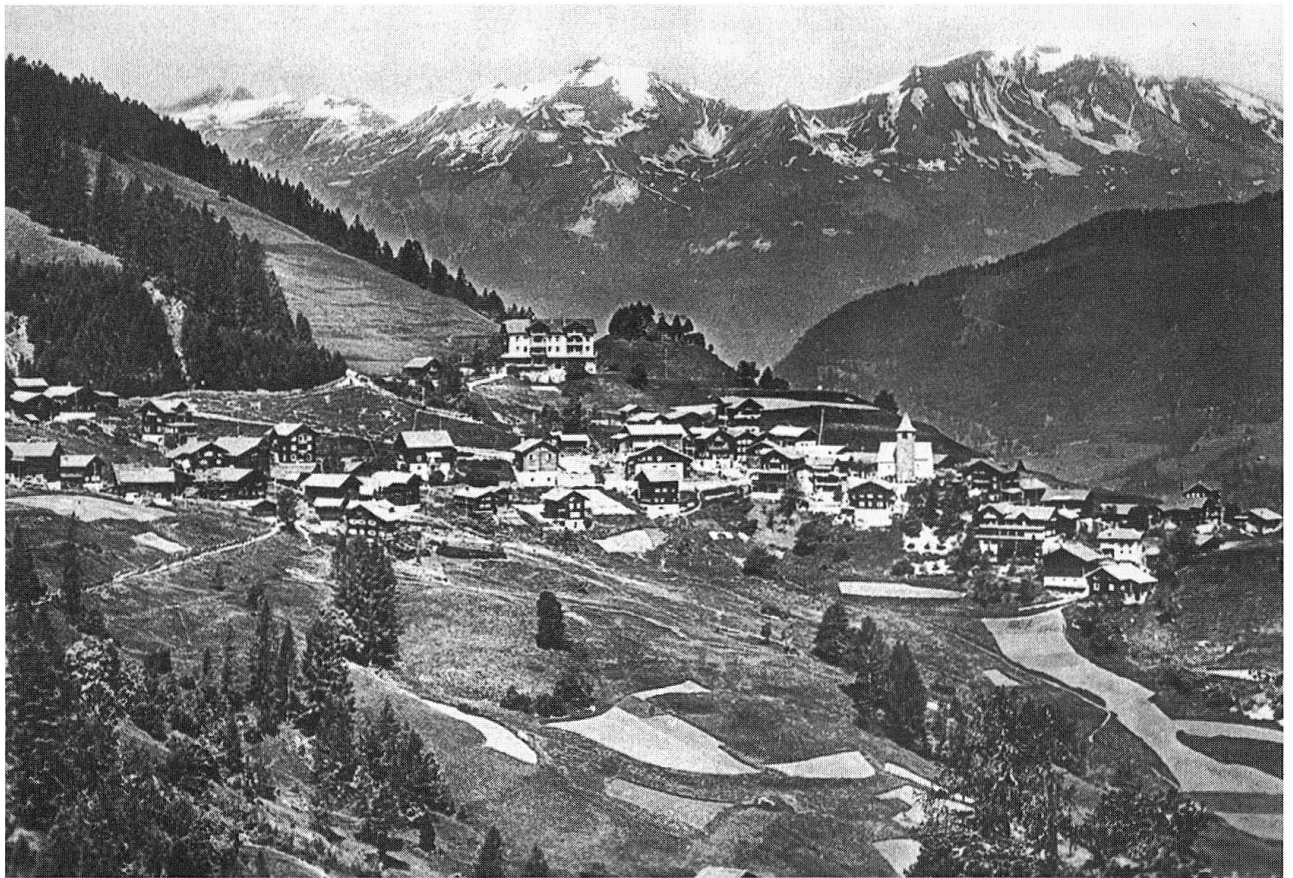
Äcker unterhalb Tschierschen, Ansichtskarte um 1900.

Der Vergleich von Verhältniszahlen weist deutlich auf die Elastizität des jeweiligen Agrarsystems und auf dessen Adaptionegrad an die jeweiligen naturräumlichen Verhältnisse hin. In Molinis, wo 1917 beinahe die gesamte Ackerfläche mit Kartoffeln bebaut wurde, stieg die Bevölkerungszahl aufgrund der wenigen Daten, die zur Verfügung stehen,