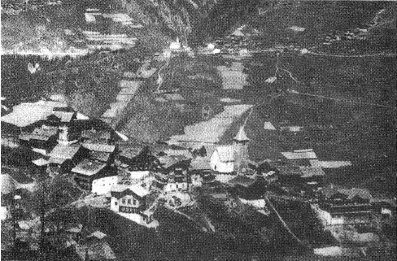
Äcker bei Castiel und Calfreisen, Ausschnitt einer Ansichtskarte, kurz nach 1900. Im Vordergrund Tschiertschen.

der Kartoffel nach 1770 wurde der Getreideanbau im Schanfigg – unter einer säkularen Optik betrachtet – sukzessive vom Kartoffelanbau verdrängt. 11 1917 wurden in Molinis lediglich noch 6 Prozent der gesamten Ackerfläche mit Getreide (ausschliesslich Sommergerste) bebaut, auf der restlichen Fläche gediehen Kartoffeln (Tabelle 2). Ähnlich sah die Lage in Praden (13 Prozent zu 87 Prozent), Tschiertschen (18 Prozent zu 80 Prozent) und Peist (20 Prozent zu 78 Prozent) aus. Die absolute Grösse des gesamten Ackerlandes dieser Dörfer scheint sich dabei im 19. Jahrhundert nicht verringert zu haben, die gesamte Ackerfläche (100 Prozent) ist flächenmässig durchaus auf das beginnende 19. Jahrhundert zu übertragen. 12