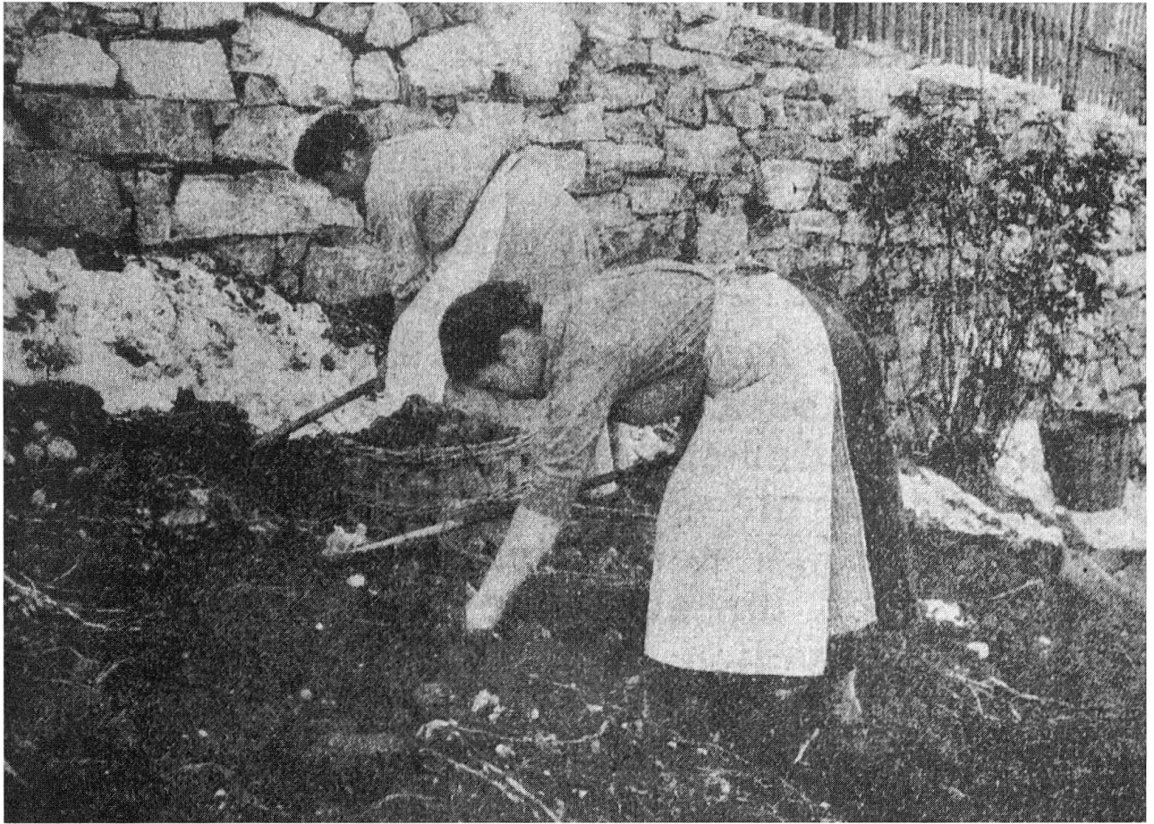
Vorwinterliche Feldarbeit auf dem Kartoffelacker, Davos 1917.