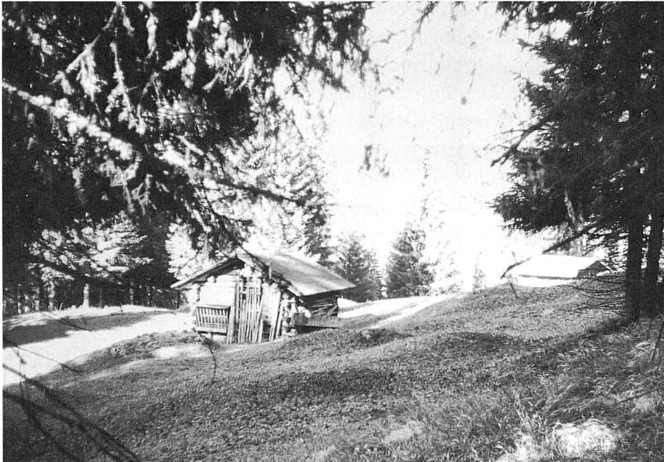
Das Maiensäss La Tschepa mit kleiner Scheune. Im Hintergrund der ehemalige Stall Gieri la Tschepas, der heute zur Jagdhütte ausgebaut ist. Die Hütte, in der Gieri hauste, steht nicht mehr.

Tiefenpsychologie erkannte, bedeutungsvolle Weisung für seinen Lebensweg vermittelt.