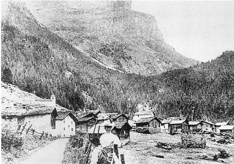
Farera/Ausserferrera (1300 m ü.M.) zur Zeit Gieri la Tschepas. Im Hintergrund Piz Grisch (3062 m ü.M.) und Crap la Maza, im Vordergrund zwei Touristinnen (aus dem Touristenheim Grischott-Etter?).

schen Renaissance» (seit etwa 1886, der Gründung der Societad Retorumantscha) auch in der Sutselva in Gang gekommen war und bereits erste literarische Früchte gezeitigt hatte (Tumasch Dolf und Schamun Mani).