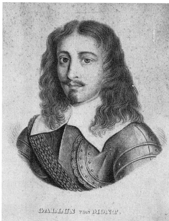
Abb. 1: Gallus von Mont (1537–1608)