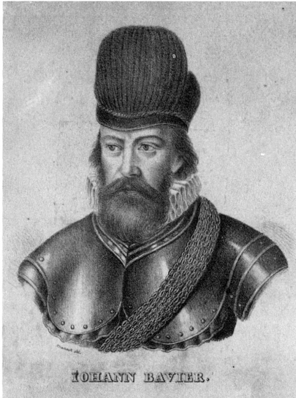
Abb. 4: (Hans) Bavier (1537–1609)