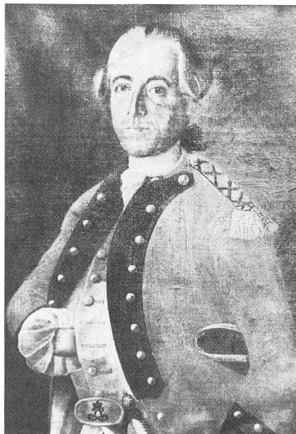
Abb. 3: Leonhard Marchion (1733–1804)