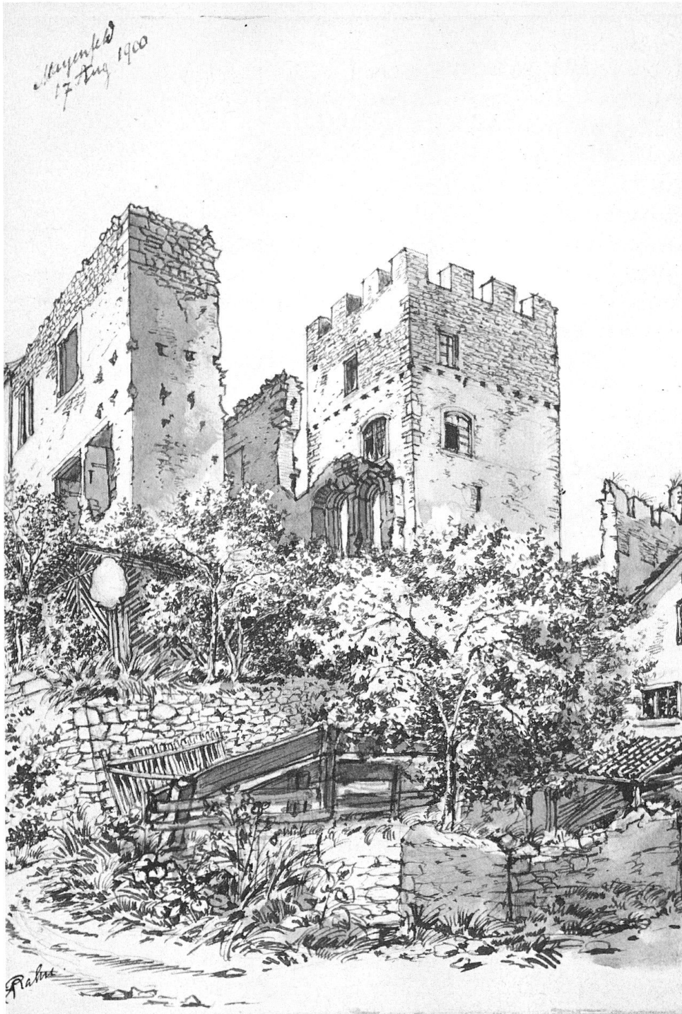
Abb. 3: Schloss Brandis in Maienfeld, ehemals bedeu- tender Feudalsitz. Im Turm Male- reien des Waltensburger Meisters. Der halb verfallene Trakt (links), das sogenannte «neue Schloss», ist durch ein Wohn- haus ersetzt worden.

Rahns geprägt. Die kostbaren Wandmalereien im Burgturm des Schlosses Brandis in Maienfeld, die frühesten Zeugnisse des sog. Meisters von Waltensburg aus dem frühen 14. Jahrhundert, wurden 1898 von Rahn entdeckt und 1900 von der Firma Christian Schmidt in Zürich, unter Rahns Leitung restauriert. Der Wandmalerei-Zyklus wurde von Johann Rudolf Rahn mit reichem Abbildungsmaterial publiziert in «Zwei weltliche Bilderfolgen aus dem 14. und 15. Jahr-