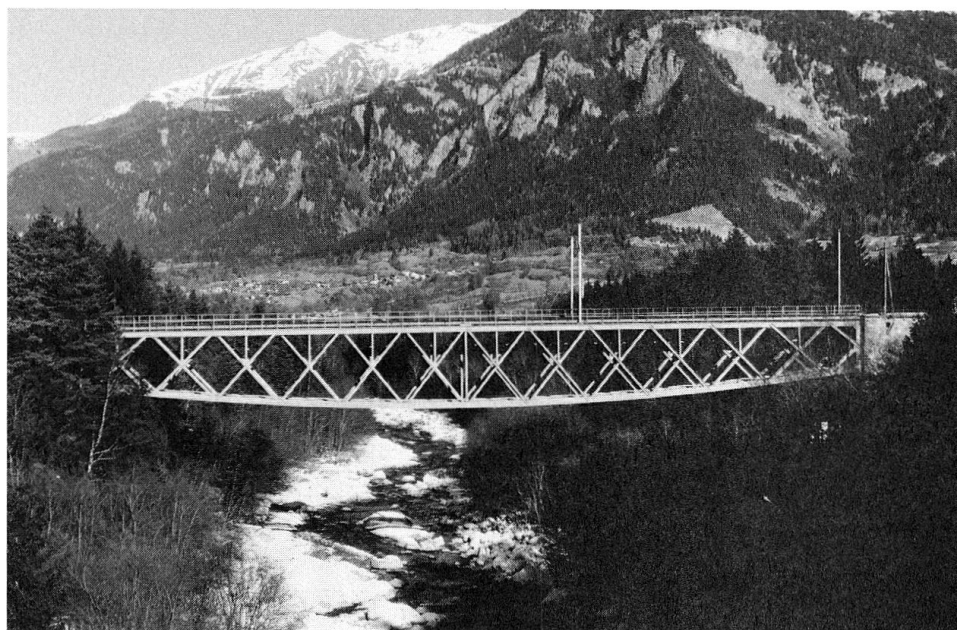
Die Hinterrhein- brücke bei Thusis