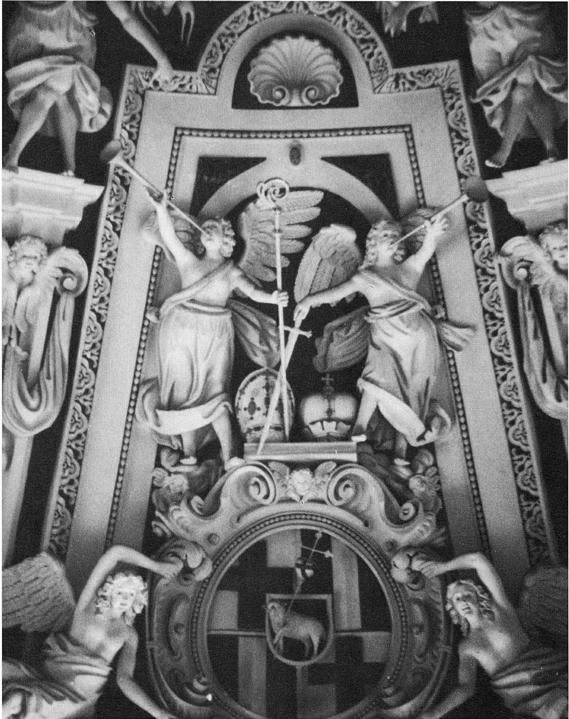
Die üppigen Stukkaturen des Westchores im Trierer Dom schuf der Tessiner Giovanni Domenico Rossi in einer Zeit, als die ersten Bündner Steinmetze in Trier erschienen. Es ist anzunehmen, dass ihm dabei die Bündner zur Seite standen. Rossi arbeitete auch in Ehrenbreitstein, hier zweifellos ebenfalls mit Bündnern zusammen.