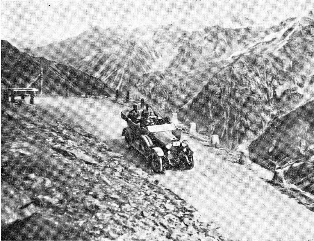
Der Wagen des Kaisers auf der Stilfserjochstrasse, aus: Lempruch, Der König der Deutschen Alpen und seine Helden, S. 116.

hätte, die damaligen Spitzkehren in einer einzigen Wendung zu bewältigen, gab es 1917 noch nicht. Die heutigen Kehren der Stilfserjochstrasse sind ganz wesentlich ausgebaut worden.