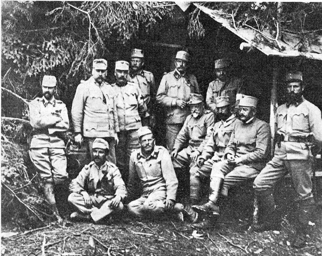
Oesterreichischer Regimentsunterstand an der Tiroler Südfront (Asiago–Arsiero) während des Ersten Weltkrieges.