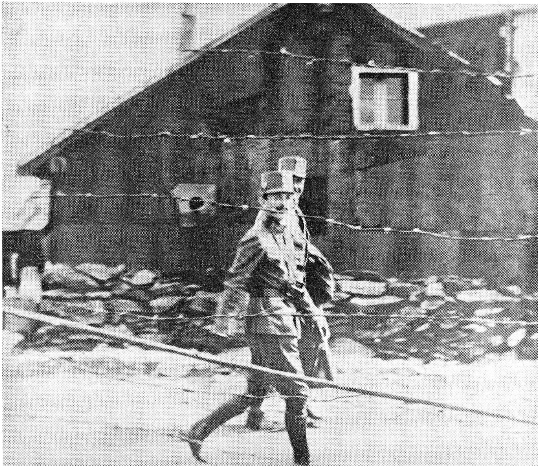
Kaiser Karl I. im Lempruch-Lager (September 1917)

man kann es mir glauben. Ich bezeuge aber, dass der Allerhöchste Herr absolute Ruhe und volle Kaltblütigkeit an den Tag legte und trotz des starken Lärmes der nahen Geschosseinschläge keinen Augenblick lang im Interesse für meine Ausführungen erlahmte.» Soweit die Ausführungen des Generalmajors, die, als Zeugnis der ergebenen Bindung eines hohen Offiziers an seinen Monarchen, heute, in einer Zeit völliger Respektlosigkeit, vielleicht zum Nachdenken anregen.