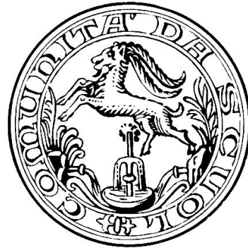
Abb. 4 Stempel der Gemeinde Scuol/Schuls von um 1935.

waren bekannt und benützt. So berichtet bereits J. J. Wagner 1680 über die Mineralquellen von Scuol-Tarasp, und 1716 erwähnt J. J. Scheuchzer die «Salz-Wässer zu Schuls, Aquae salsae Scolienses». Weiter schreibt im Jahre 1717 Anhorn de Hartwyß eine Abhandlung «De Salsulis Scoliensibus», 1689 betitelt D. Giov. Battista de Burgo eine Abhandlung «Descriptione dell' acque minerali e salse di Scul» und Bavier, Grassi und Schwarz schreiben 1747 «Von dem Saltz-Wasser zu (Scuol) Schulßs in dem nderen Engadein». Diese Paar Beispiele, die sich vermehren ließen, zeigen, daß die Erwähnung der Schulser Mineralquellen im Gemeindesiegel nicht ganz von ungefähr kommt.