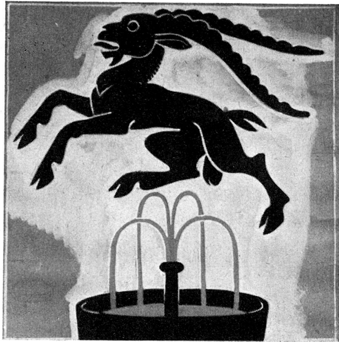
Abb. 5 Entwurf P. Boesch 1939 für das Landifähnchen.

pell um 1570 in seiner Topographie als « alia porta adhuc hodie extans ad Pontem » erwähnt. Allein dieser Turm trug bei seiner Renovation im Jahre 1934 auf der dem Dorfe zugekehrten Seite einzig eine romanische Inschrift mit der Jahreszahl 1661, dem Datum einer früheren Renovation, und auf der Inn-Seite standen die Wappen der Drei Bünde und wiesen nach dem damals noch ausländischen Tarasp.