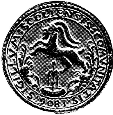
Abb. 3 Siegel der Gemeinde Scuol/Schuls vom Jahre 1806 nach Siegelstempel.

Gemeinde Scuol bis zu deren Ablösung im Jahre 1904 auf weiten Teilen des Tarasper Territoriums das sogenannte «ius lignandi», das heißt das Recht der Bäume auf fremdem Boden. Wohl aus diesem Grunde werden die Tarasper Mineralquellen in Nairs öfters der Gemeinde Scuol zugeschrieben. Aber auch die Schulser Mineralquellen in Nairs