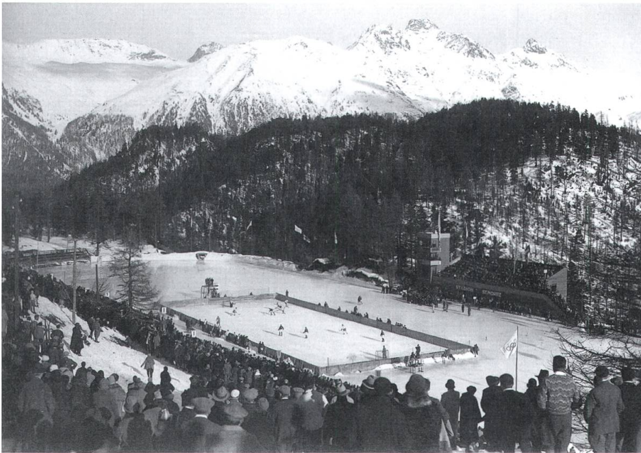
Das Spektakel zieht die Massen an: Eishockeyspiel im Olympiastadion St. Moritz um das Jahr 1930.