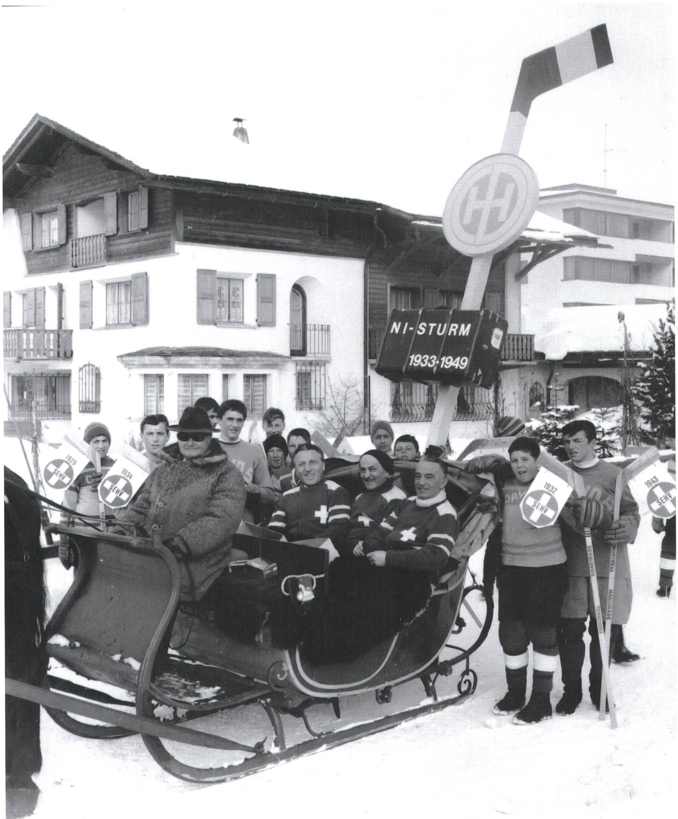
Der berühmte ehemalige ni-Sturm des Hockey Clubs Davos: «Bibi» Torriani, Hans Cattini und «Pic» Cattini (von links).