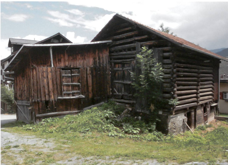
Leer stehende Stallscheune mit angebautem Schopf, ein ortsbildprägendes Objekt am östlichen Dorfrand von Vignogn.

Seit Januar dieses Jahres ist das Zweitwohnungsgesetz in Kraft. Dieses sieht vor, dass in Gemeinden mit einem Zweitwohnungsanteil von über 20 Prozent sogenannte «ortsbildprägende Bauten» innerhalb der Bauzone zu Ferienzwecken umgenutzt werden können, wenn keine andere Möglichkeit für ihre Erhaltung besteht. Als «ortsbildprägend» gelten Gebäude, «die durch ihre Lage und Gestalt wesentlich zur erhaltenswerten Qualität des Ortsbildes und zur Identität des Ortes beitragen». Bauwerke also mit (möglicherweise) bescheidenem Eigenwert, denen im Rahmen eines Ensembles aber grosse Bedeutung beigemessen wird. In unseren Dorfkernen gehören dazu potentiell alle in ihrer ursprünglichen Erscheinung noch intakten historischen Gebäude – mithin auch die alten Stallscheunen, die man in praktisch jeder Bündner Ortschaft in einer Vielzahl antrifft. Durch den Strukturwandel in der Landwirtschaft ihrer ursprünglichen Funktion entledigt, stehen sie heute brach und scheinbar unnütz da. Nun bieten sie bauwilligen Feriengästen eine Möglichkeit, ihren Traum vom eigenen Ferienhaus trotz Zweitwohnungsbaustopp doch noch zu erfüllen.