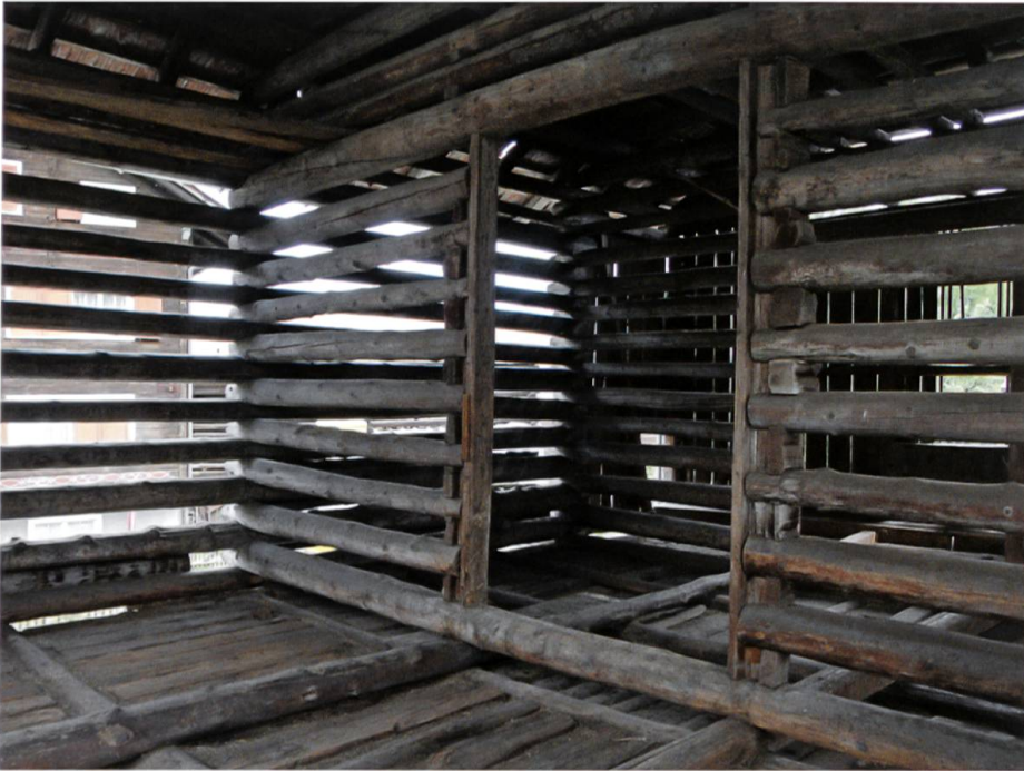
Die Struktur der Scheune mit dem breiten, einst auch als Dreschboden genutzten Mittelgang, an den sich beidseitig verschiedene Kompartimente zur Trennung von Heu und Stroh aufreihen, wurde zum Ausgangspunkt des Umbauentwurfs.

Allerdings: Eine Zweckänderung der im besten Sinne primitiven Bauwerke ist architektonisch schwer zu bewältigen, da sich Konstruktion und Bauweise nicht ohne weiteres für den Umbau in Wohnraum nach heutigen Komfortvorstellungen eignen. Erschwerend hinzu kommt die anspruchsvolle Bestimmung, wonach eine ortsbildprägende «Baute in ihrem Schutzwert» durch die Umnutzung nicht beeinträchtigt werden darf; «insbesondere die äussere Erscheinung und die bauliche Grundstruktur des Gebäudes» muss, so will es das Gesetz, «im Wesentlichen unverändert bleiben». Auf einen landwirtschaftlichen Ökonomiebau übertragen heisst dies: Er muss seine historische Funktion nach aussen abbilden, auch wenn er nicht mehr zur Lagerung des Winterfutters gebraucht und auch keinem Vieh mehr als Unterstand dient, sondern als behagliche Behausung für Menschen einer Wohlstandsgesellschaft eingerichtet ist.