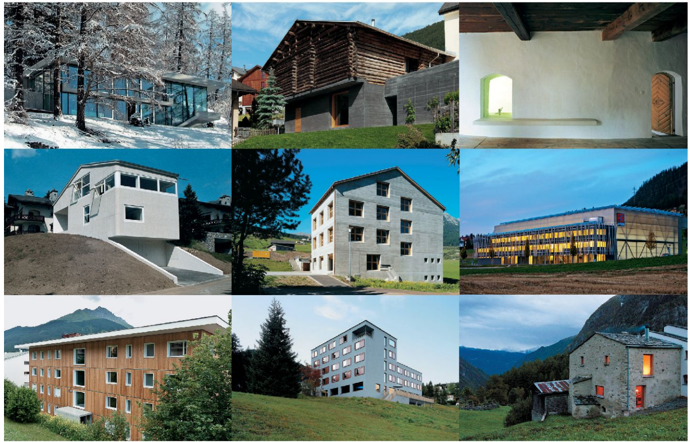
Waldhaus Tgaplottas in Alvaneu von Cavigelli Architekten , Domat/Ems; René Hauser, Bauträgerschaft; Pöyry, Bauingenieure; Bruno Helbling, Fotograf.