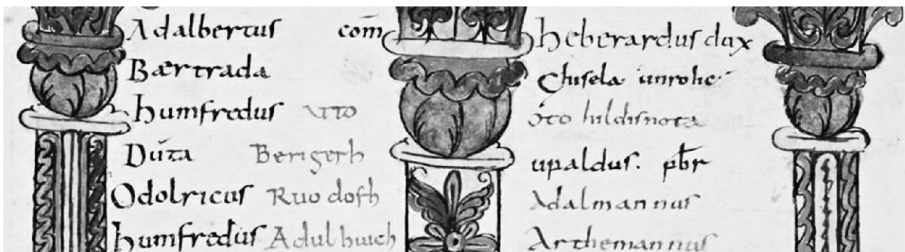
Rätische Grafenfamilie (Cod. Fab. 1, p. 66).