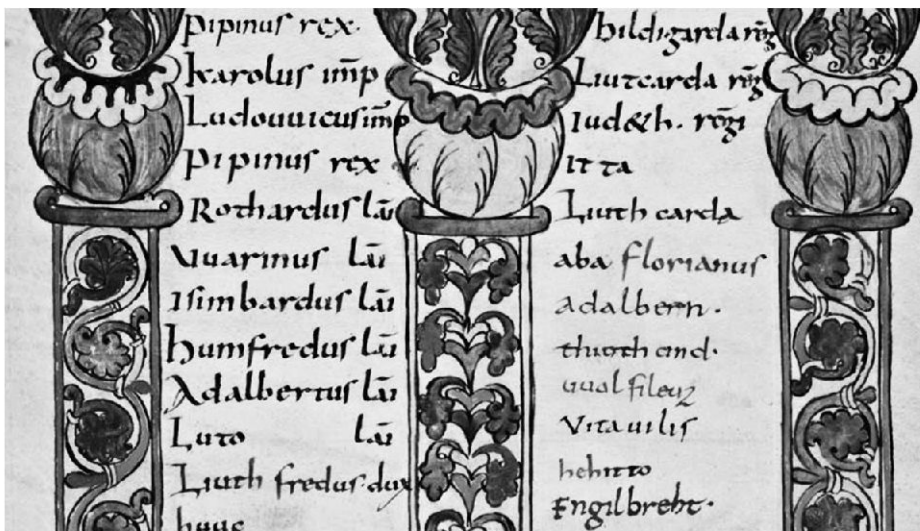
«Herrscherdiptychon» (Cod. Fab. 1, p. 24).

Dieser Eintrag nennt die Königinnen Hildegard und Lütgard, zwei der Ehefrauen Karls des Grossen, Judith, die zweite Ehe-