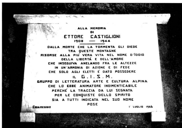
Gedenktafel an der Kirche von Chiareggio (Valmalenco), angebracht vor 50 Jahren

schem Blickwinkel. Das ist ein Anfang. Was folgen müsste, wäre das Formulieren eines Forschungsprogramms sowie die entsprechenden Forschungen. Vielleicht konnte die Salecina-Tagung dazu einen kleinen Anstoss geben.