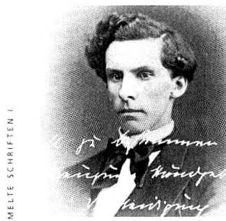
Generalstabschef Theophil Sprecher von Bernegg