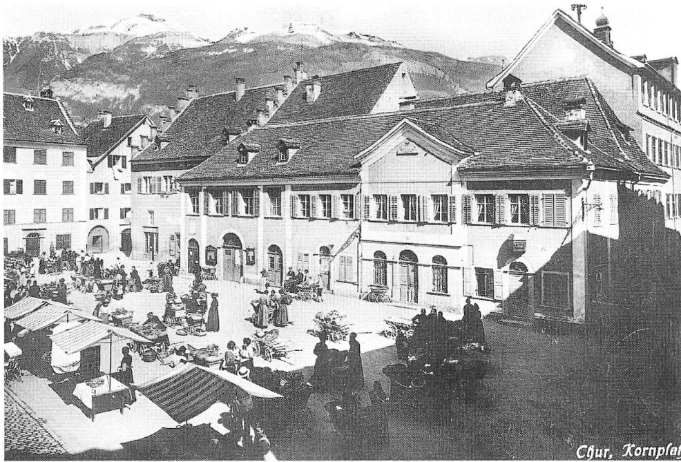
Abb. 4: Ansicht nach 1906.

Im Stadtarchiv liegen zwei Pläne, die zum oben erwähnten Projekt-satz gehören. 40 Es handelt sich nicht um die ausgeführten Pläne, was aus dem weiteren historischen Ablauf ersichtlich wird. Sie sind sorgfältig in Tusche gezeichnet und teilweise laviert. Eine Signatur fehlt. Das aufwendigere Projekt (Abb. 2) fasst den Chor mit dem Vorbau zu einem dreistöckigen Zentralbau mit Mansardendach zusammen, der als solcher erst im zweiten Obergeschoss erkennbar wird, indem vier durch eine Brüstung verbundene Säulenpaare in Eckposition einen inneren Raum aus-scheiden. Im Umgang befinden sich in den westlichen Ecken je ein Turm-ofen, in der nordöstlichen eine Wendeltreppe und in der südöstlichen ein nicht differenzierbarer Schacht (Abtritt, Kamin?). Im ersten Oberge-schoss und im Parterre bleibt der Chor bis auf den Türeinbruch in der Mitte der Südmauer unangetastet. Der Vorbau ist im Erdgeschoss dreige-teilt, an der Fassade markiert durch einen wenig vorstehenden Mittel-risalit mit über den Dachansatz hochgezogenem Giebel.