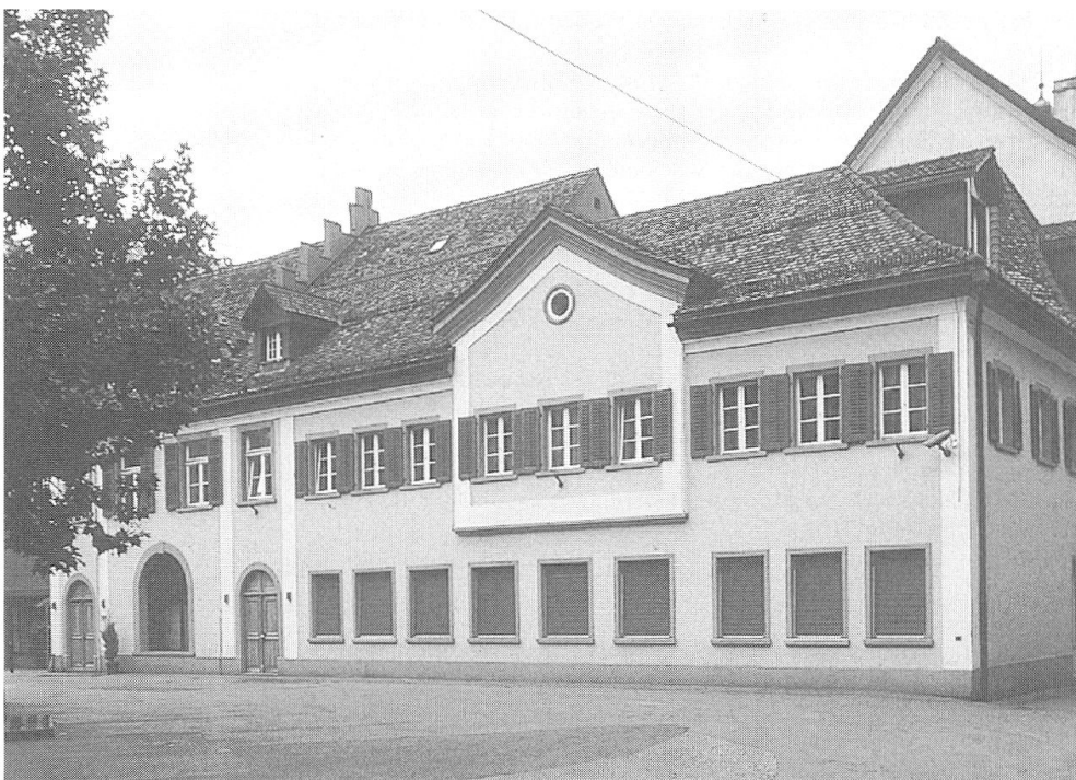
Abb. 1: Ansicht Kirche mit Vorbau von 1827/28. (Aufnahme B. Keller, Juni 2000).

Am 26. Oktober 1658 hatte die Stadt das Nicolaikloster käuflich erworben unter der Bedingung, die Kirche (Abb. 1) nicht für evangelische Gottesdienste zu nutzen. 1 Anfänglich wurden Teile des Klosters verkauft, so die ehemalige Pfisterei (Bäckerei), oder zu Wohnzwecken und als Werkstätten vermietet, bis man definitiv entschieden hatte, was mit den Gebäulichkeiten geschehen sollte, was allerdings noch Jahre dauerte. 2 1670 legte der Stadtrat ein Projekt vor mit den Varianten, das