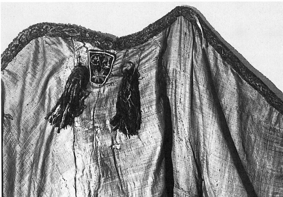
Scharfrichtermantel, 18. Jahrhundert, aus Ilanz. (Objekt und Foto: Rätisches Museum Chur)

Das andere Symbol der Machtausübung ist der rote Scharfrichtermantel als Zeichen des örtlich auszuführenden Blutbanns. 78 Er wurde dem Scharfrichter durch die Stadt bezahlt. 79