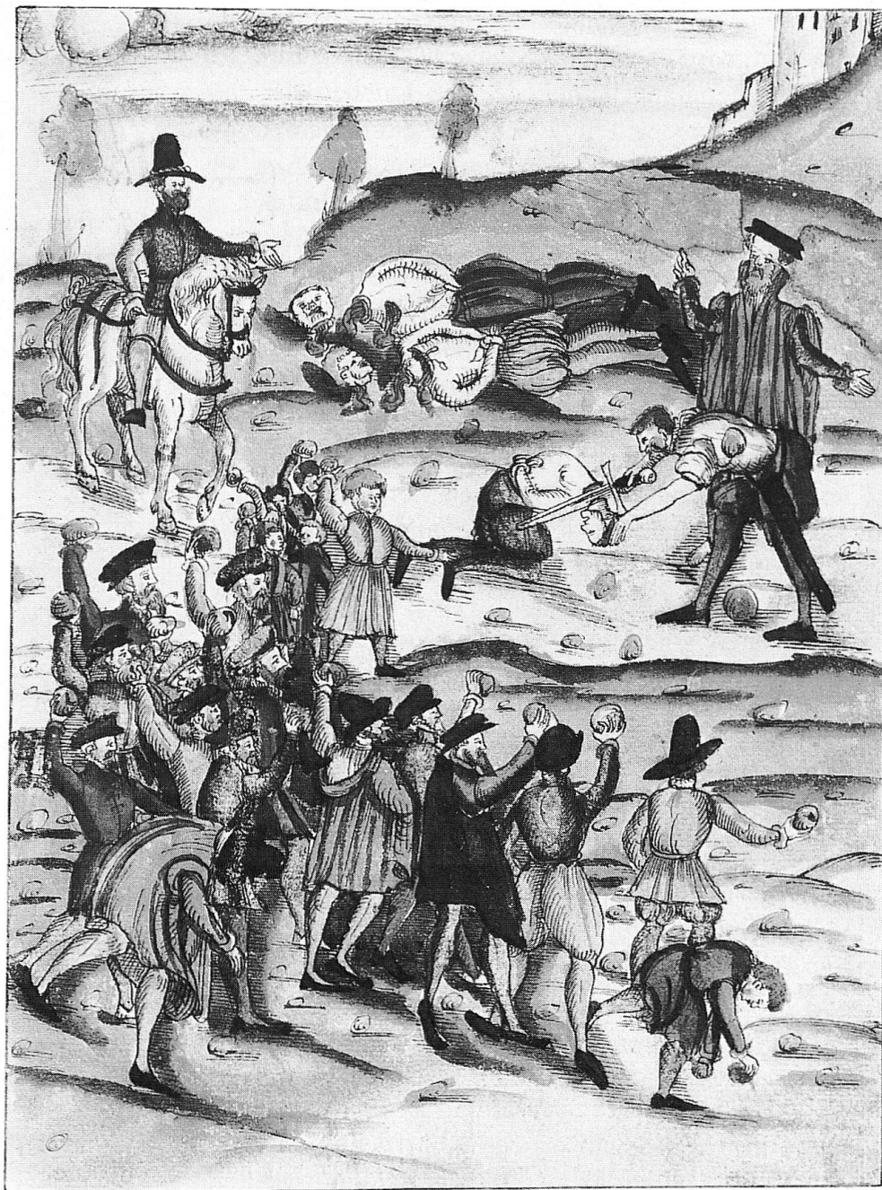
Steinigung des be- trunkenen Scharf- richters, Chur 1576, Aquarell in der Nach- richtensammlung des J.J. Wick (Wickiana). (Objekt und Foto: Zentralbibliothek Zürich, Graphische Sammlung)