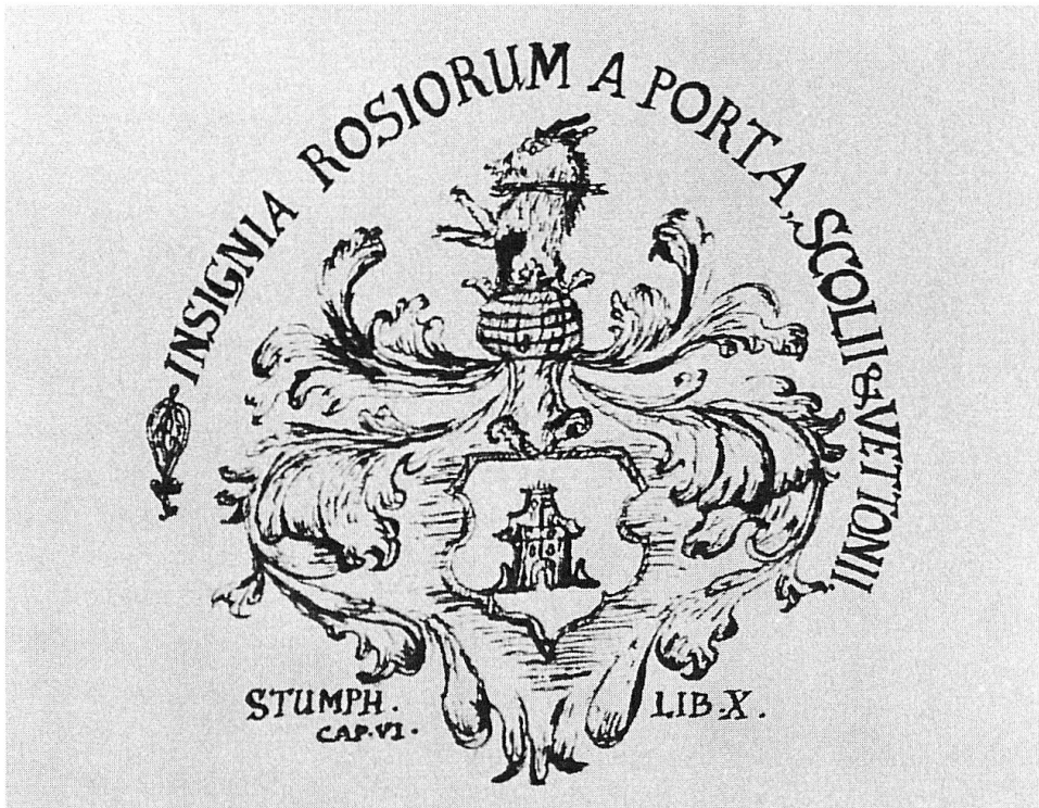
Wappen der Familie Rosius à Porta nach einer Federzeichnung des Kirchenhistorikers

Kein historisches Werk des 18. Jahrhunderts ist für die Bündnergeschichte des 16. Jahrhunderts so ergiebig und wertvoll, wie die Historia Reformationis Ecclesiarum Raeticarum des aus Ftan im Untereggadin stammenden reformierten Pfarrers Petrus Domenicus Rosius à Porta (1732–1806). Sein Hauptwerk hat dem Pfarrer und Kirchenhistoriker wenig Ruhm und noch weniger Geld eingebracht. Es zählt heute aber zu den wichtigsten Werken der Bündnergeschichte und gehört, vor allem für Studien zur Geschichte des 16. und beginnenden 17. Jahrhunderts, zu den unentbehrlichen Hilfsmitteln. Um so erstaunlicher ist es, dass dem Leben und dem Gesamtwerk des Kirchenhistorikers bisher wenig Beachtung geschenkt wurde. So fehlt es an einer ausführlichen Biographie ebenso wie an Studien über seine Werke. 1 Umfangreiches Material, das sich im Archiv der Familie Salis-Zizers befand