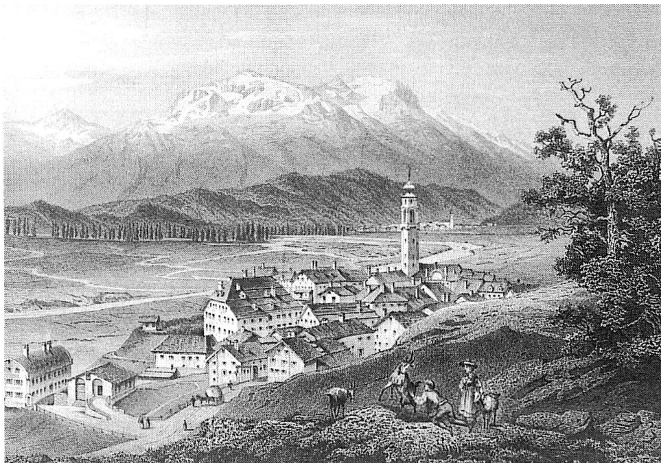
Das Planta-Haus in Samedan, Stahlstich von Ludwig Rohbock aus der Mitte des letzten Jahrhunderts. Der nördliche Teil war ursprünglich Stammsitz der Salis-Samedan und wurde um 1595 ausgebaut.

romanische Gemeinden lagen. Das Oberengadin selbst war Teil des Freistaates der Drei Bünde, eines zugewandten Ortes der Eidgenossenschaft, dessen politische Geschäfte vorzüglich in deutsch abgewickelt wurden; im Gegensatz dazu war der Handel des Engadins zumeist auf das italienische Mailand im Süden ausgerichtet, wo der Hauptabsatzmarkt für das Vieh und die Milchprodukte des Tales war. 8