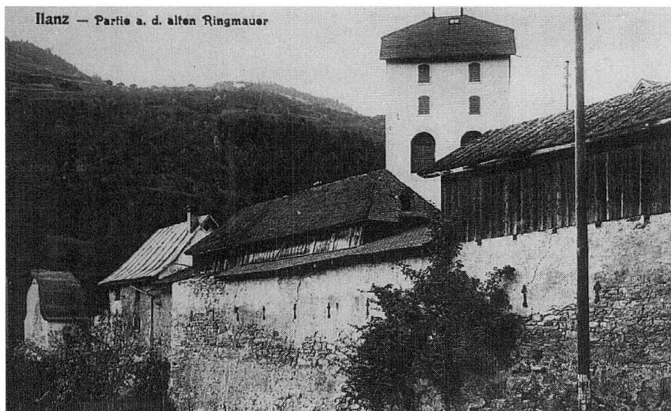
Ilanz: Partie der alten Ringmauer zu Beginn des 20. Jahrhunderts

Die eigentliche Gründungsstätte des Grauen Bundes deuten schon seit Beginn des 19. Jahrhunderts einige kritischere Historiker unmissverständlich an. Johann Ulrich von Salis-Seewis (1777 – 1818) schrieb um ca. 1810: «Sodann schloss sich der Freiherr von Rätzüns Ulrich Brun in Ilanz am 21. Februar (in Wahrheit am 14. Februar) 1395 unter Bedingungen, die zum Teil wörtlich in den späteren Bundesbrief von 1424 übergegangen sind, so wie die Zusammensetzung dieses Bundes aus drei <Teilen> unter drei <Hauptherren> seit 1395 bis 1800 bestanden hat.» 55 «Die Artikel von 1395 sind, nun ausführlicher, beibehalten worden ... unter dem Ahorn zu Trun». 56 Konradin von Moor (1819 – 1886), zum Trunser Bund: «Im ganzen wurden die Artikel des im Jahre 1395 geschlossenen Bundes beibehalten». 57 Im gleichen Sinne äussert sich Wolfgang von Juvalt (1838 – 1873): «Der wirkliche Stiftungsbrief des «Oberen Teils» (Grauen Bund) datiert von