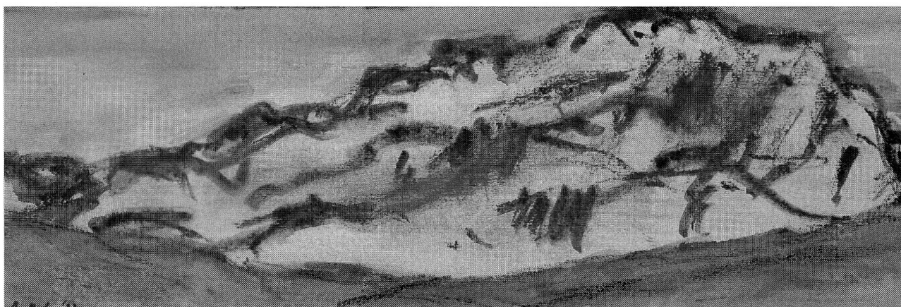
Gouachen: Richard Butz, St. Gallen, 1990.