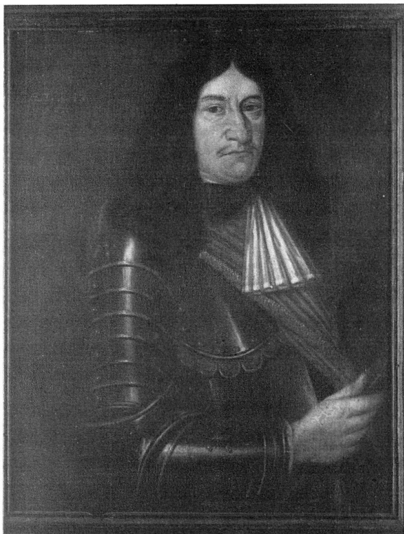
Abb. 8: Paul von Jenatsch (1629–1676)