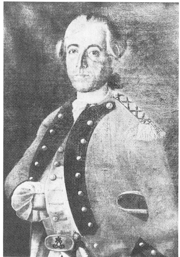
Abb. 3: Leonhard Marchion (1733–1804)