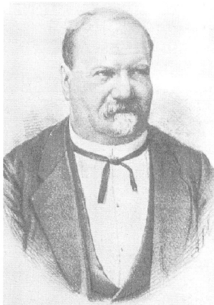
Abb. 4: 1892 stirbt Stän- derat Remigius Peterelli während der Wintersession in Bern.