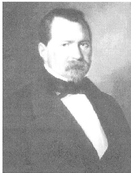
Abb. 1: Remigius Peterelli, 44jährig. Ölporträt, gemalt 1859 vom Bünd- ner Maler Giovan- ni Antonio Rizzi (vgl. BM Nr. 10/1940, S. 289–303).

Die grössere zeitliche Distanz ist durch den historischen Kontext im gleichen Masse einer Relativierung der Ereignisse zuträglich wie sie dem Erfassen des historischen Zeitempfindens abträglich ist.