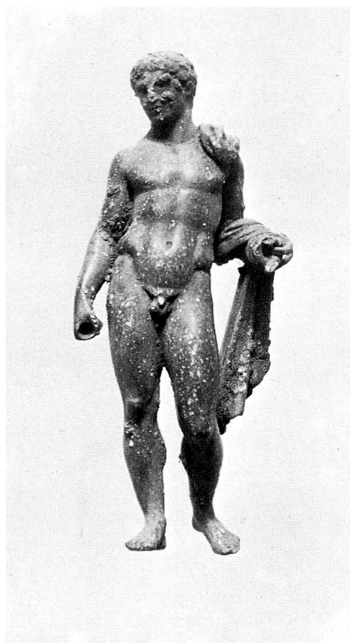
(Archäologischer Dienst Graubünden)