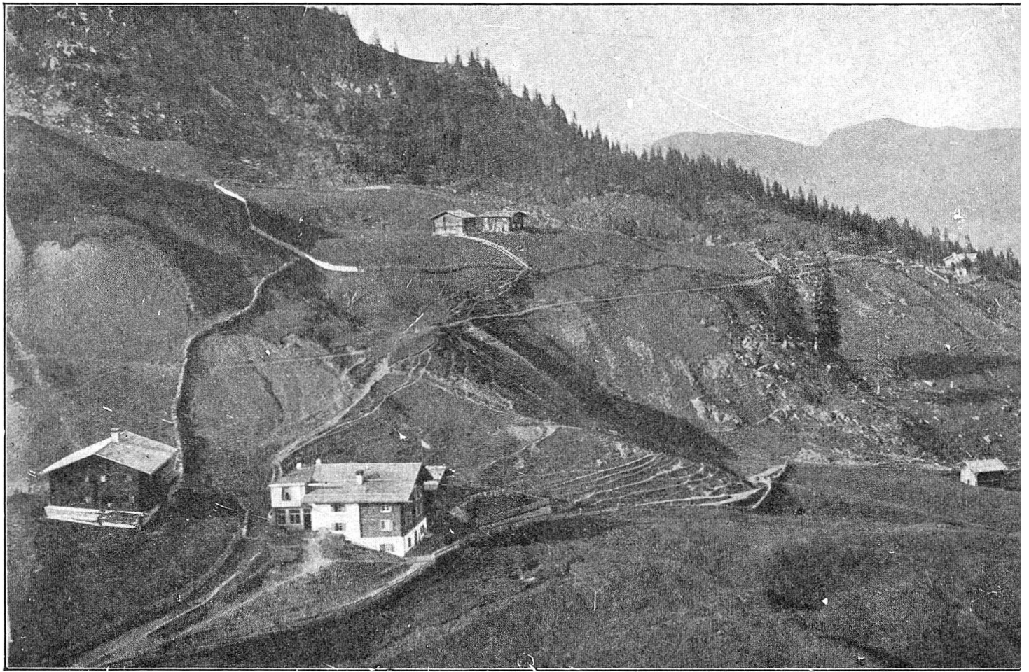
Das Leinegga-Schulhaus, links, Aufnahme ca. 1885. Das erste Schulhaus von Arosa.