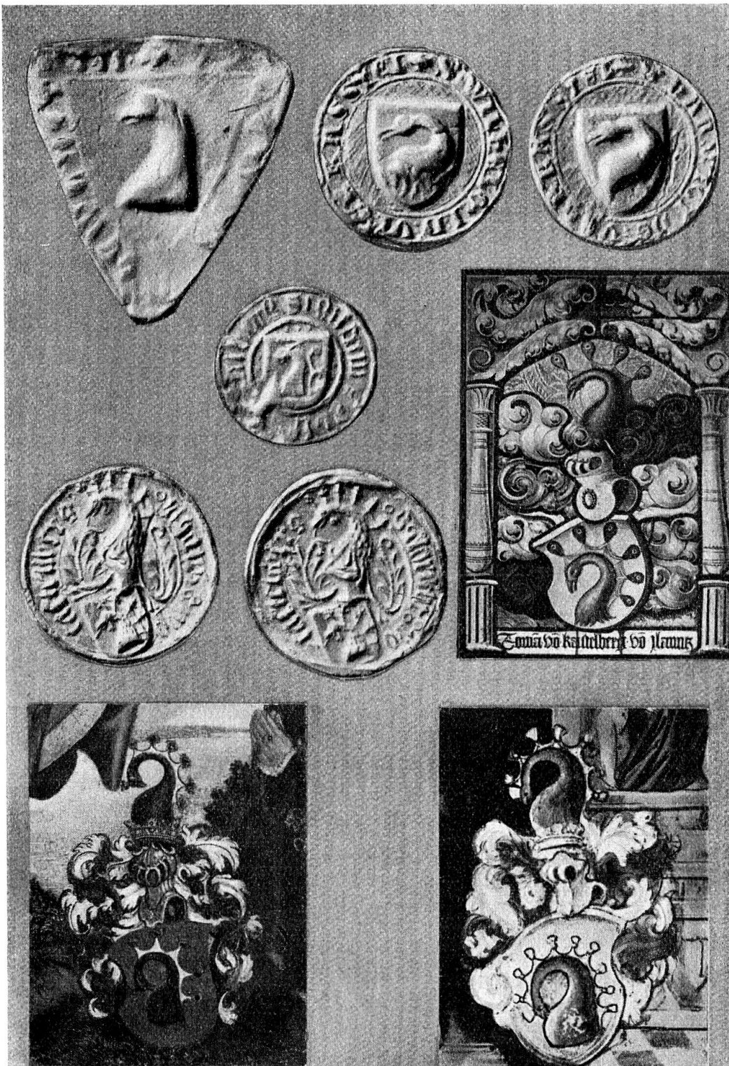
Oberste Reihe: Fig. 1 Hartwig v. Löwenstein 1289; Fig. 2 Wilh. v. Überkastel 1354; Fig. 3 Hartwig v. Überkastel 1410. Kleiner Siegel: Fig. 4 Duff v. Castelberg 1462. Dritte Reihe: Siegel: Fig. 5 Hans v. Castelberg 1494; Fig. 6 Albrecht v. Castelberg 1524; Fig. 7 Wappenscheibe Thomas v. Kastelberg, Ilanz. Unterste Reihe: Wappen: Fig. 8 Sebastian v. Kastelberg (Castelbergaltar) 1572; Fig. 9 Sebastian v. Kastelberg (Glasscheibe) 1585. (Siegel in natürlicher Größe.)