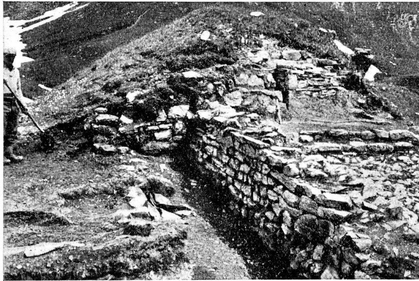
St. Peterskapelle von Nordwesten, links Raum B.

Nach erfolgter Einrichtung der Wohnbaracke konnte am 8. Juli um 11 Uhr mit der eigentlichen Ausgrabungsarbeit begonnen