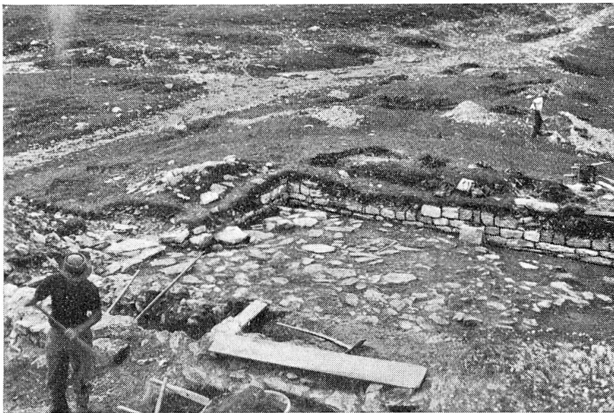
Raum A von Südosten; links im Vordergrund Nordmauer Raum B; im Hintergrund Septimerstraße.

Eine genaue Beschreibung des Raumes A enthält Heft 12 des Bündn. Monatsblattes 1935. Bei der vollständigen Ausräumung des Schuttmaterials fanden sich nur einige wenige bearbeitete Steine des Mauermantels; der weitaus größte Teil ist beim späteren Bau des weiter südlich gelegenen Hospizes verwendet worden. Der unregelmäßige Plattenbelag des Bodens kann auch vom eingestürzten Dach stammen. Die Schiefer lagen teilweise zwei-