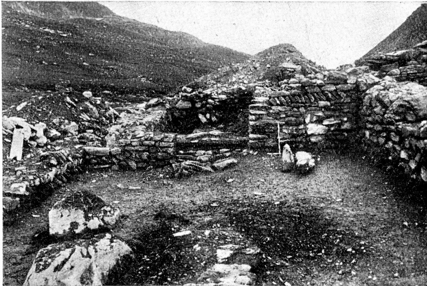
Raum E von Süden mit Verbindungstüre nach Raum D.

dem der westlichen. Er trägt eine 20 bis 30 cm starke Kohlen- und Aschenschicht; an der Ostseite liegen in dieser Steinplatten, wohl Überreste von Feuerstellen. Auf diese Stelle war längs der Westwand der Kapelle von Norden her eine schlecht ausgeführte Mauer von zirka 90 cm Stärke gestellt, aber nicht etwa auf die ganze Raumbreite, sondern so, daß sich in der Südostecke des Raumes eine rund 70 cm breite Nische ergab. Ungefähr in der Mitte dieser Vormauer verläuft ein Fundament von Osten nach Westen bis zur oben genannten Trennmauer. Auch diese ruht nicht auf dem gewachsenen Boden auf. Ob diese Steine zu einer Herdstelle oder zu einer späteren Treppe gehörten, die den Zugang zur