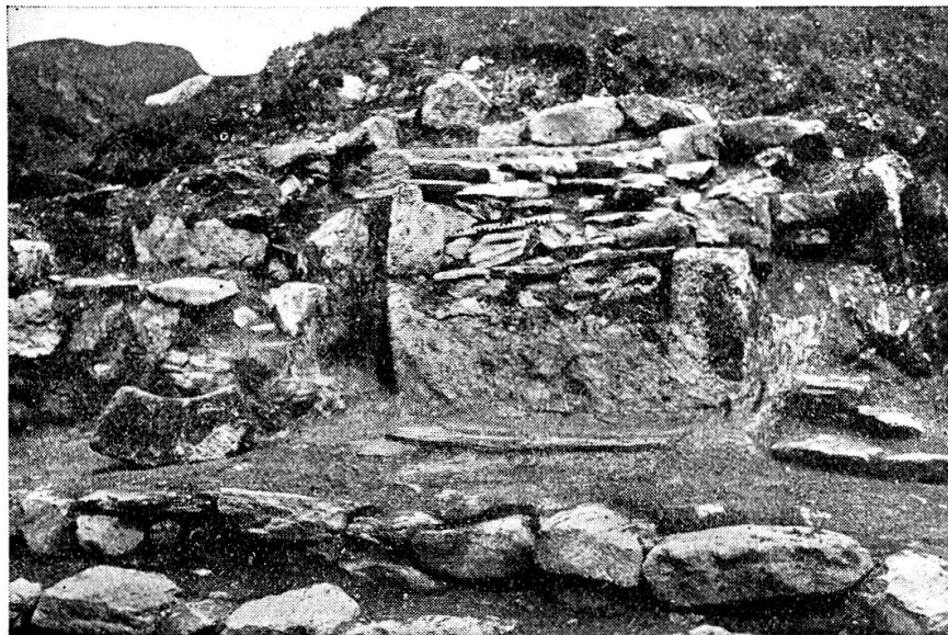
Altar der St. Peterskapelle; links Gewölbestein vom nördlichen Nebeneingang.