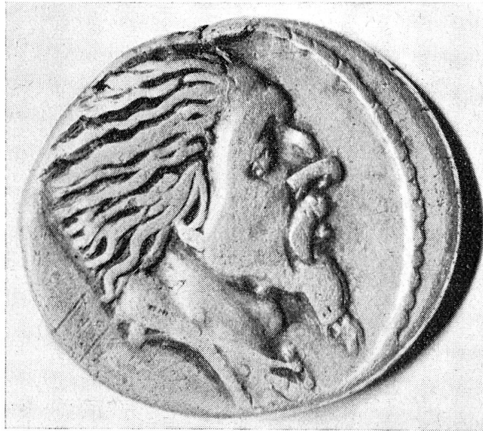
Silberdenar des L. Hostilius Saserna, um 46 v. Chr. zirka viermal vergrößert.