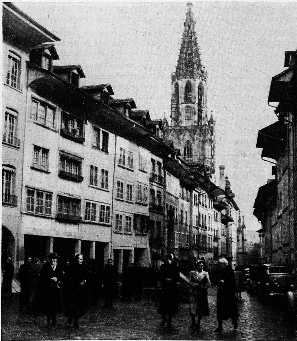
Nach der Predigt im Münster begeben sich Gäste und Schwestern ins Casino

Vor allem begrüße ich Euch, Ihr Schwestern vom Lindenhof, die Ihr von nah und fern gekommen seid, um Eurer Schule Eure Verbundenheit und Liebe zu bezeugen. In den 50 verflossenen Jahren ist durch Eure Hingabe, durch Eure strenge Arbeit, durch Eure gewissenhafte Pflichterfüllung der Ruf unserer Schule begründet worden. Ihr seid die lebendigen Träger, auf deren Schultern unsere Schule ruht, Ihr habt ihr durch Eure hilfebereiten Hände und durch den Einsatz Eures Herzens Namen und Achtung verschafft, und darum seid Ihr unsere verdientesten Ehrengäste, die ich in Dankbarkeit vor allen andern willkommen heisse.