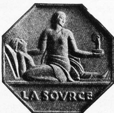
Insigne des infirmières diplômées de La Source

Tous les manuels d'histoire du nursing racontent comment Florence Nightingale ouvrit, en 1860, à Londres, sa fameuse école d'infirmières qui servit de modèle à beaucoup d'institutions semblables qui se fondèrent plus tard dans de nombreux pays. Plusieurs de ces manuels, toutefois, rappellent qu'un an plus tôt, à Lausanne, s'était ouverte une école qui peut se dire, à juste titre, la première en date de toutes les écoles d'infirmières du monde. C'est l'Ecole normale évangélique de gardes-malades,