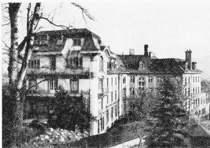
Der Lindenhof in Bern

Voraussicht, dass dieser Verband in der Nachkriegszeit eine wichtige Aufgabe innerhalb des Weltbundes zu erfüllen haben werde, liess der Leitung des «Nationalverbandes» und auch uns eine Fusion mit dem «Schweiz. Krankenpflegebund» als wünschenswert erscheinen. Wir begrüsst deshalb die Fühlungnahme der beiden Verbände anlässlich dieser Berner Tagung und stellten uns zur Mitarbeit an einer Neuorganisation zur Verfügung. Dank der Mithilfe der Vertreter des Schweiz. Roten Kreuzes wurde schon am 3. Dezember 1944 in einer ausserordentlichen Delegiertenversammlung der «Schweiz. Verband diplomierter Krankenschwestern und Krankenpfleger» (SVDK) durch die Fusion des Krankenpflegebundes mit dem Nationalverband zur Tatsache. Es war uns eine grosse Genugtuung, dass zu dessen Präsidentin eine der Unsern, unsere Vertreterin im Comité des «Nationalverbandes», gewählt wurde. Dass diese Wahl eine glückliche war, hat sich in der Folge reichlich erwiesen und das Ansehen, das unser SVDK heute schon innerhalb des Weltbundes geniesst, hat wohl auch unserer Voraussicht recht gegeben.