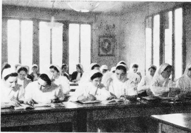
Im Schulzimmer der Rotkreuzpflegerinnenschule Lindenhof Bern

ihrem Umkreis lebenden Schwestern um sich, diskutieren mit ihnen die «Fragen der Schule und der Schwesternsache» und natürlich auch persönliche Probleme, bieten ihnen Anregung für Geist und Gemüt und stellen so den Kontakt zwischen ihnen und mit ihnen her. Die Gruppenleiterinnen selbst sind in Verbindung mit der Präsidentin und durch diese wiederum mit der Schule. Sie versammeln sich einmal im Jahr zu gegenseitigem Austausch. Der Schwesternmangel und die Ueberbeanspruchung jeder einzelnen lassen zwar unsere Zusammenkünfte manchen als überflüssig erscheinen, aber es hat sich doch schon da und dort die Einsicht durchgesetzt, dass wir nur gemeinsam zum Ziele kommen. Jedenfalls erfordert das Amt der Gruppenleiterin sehr viel Geduld und Ausdauer.