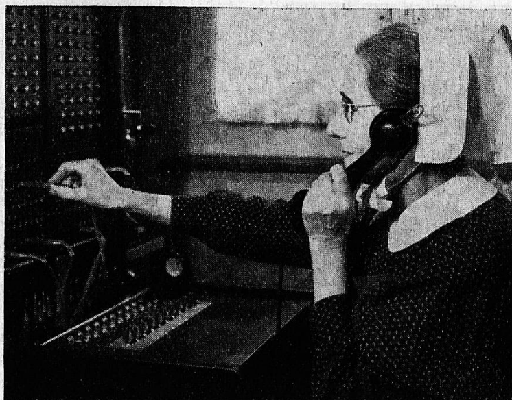
In der Telephonzentrale.

sich bisweilen die psychischen Krankheitserscheinungen ins Unerträgliche. Die Patienten sind dauernd unzufrieden und haben an allem etwas auszusetzen. Viele neigen zum Grübeln, werden ungesellig und mürrisch. Schwestern, Leidensgefährten und Besucher erregen ihr Missfallen, die Speisen werden mit unsachlicher Kritik zurückgewiesen, veränderliches Wetter bringt ihnen Kopfschmerzen und vermehrt das Nörgeln.