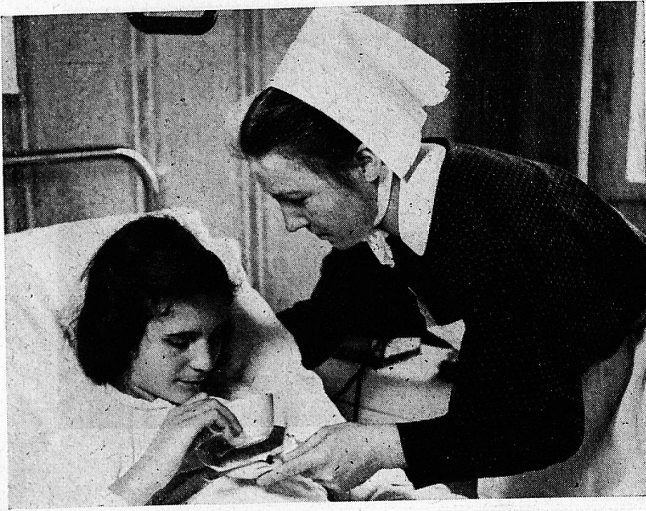
Vielgestaltiger Dienst in der Diakonie: Am Krankenbett.

Chronisch ist eine Krankheit, die nur langsam oder gar nicht zur Heilung führt. Sie kann sich jahrelang hinziehen. Oft bringt sie Defektheilung und Invalidität, oder das krankhafte Geschehen kommt überhaupt nicht zum Stillstand. Die akute Krankheit endet nach wenigen Tagen oder Wochen mit Besserung und Genesung: Der Patient steht auf und sieht die Entlassung aus dem Spital herannahen. Die chronische Krankheit verschlimmert sich: Sie bringt Siechtum, Bettlägerigkeit und Gebrechen. Ihr Ziel ist der Tod.