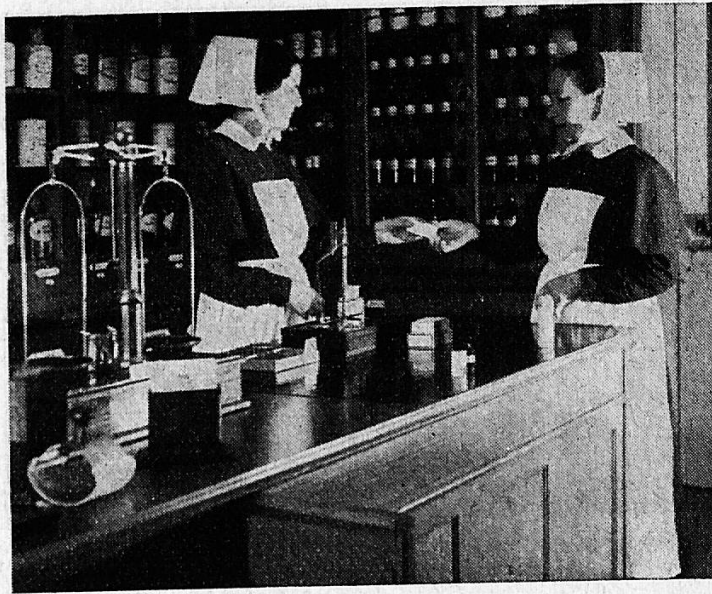
In der Apotheke.

zweckmässige Gruppierung lassen sich Unverträgliche von einander entfernen. Ansprechendes Servieren der Speisen fördert den oft mangelhaften Appetit. Für ein abwechslungsreiches Menu hat die Spitalverwaltung zu sorgen. Es empfiehlt sich, von Zeit zu Zeit ein Festchen zu veranstalten, um etwas mehr Bewegung in den eintönigen Alltag des Krankenhauses zu bringen.