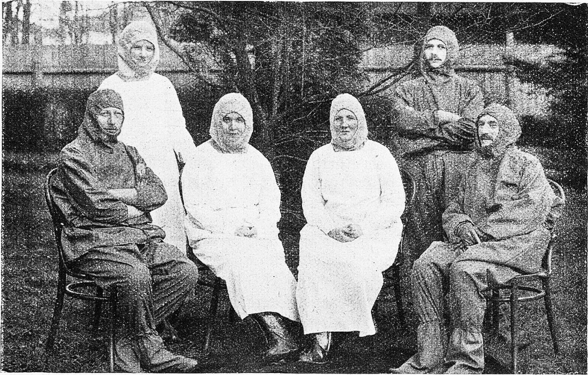
Schutzkleidung des Pflegepersonals in einem österreichischen Quarantänepital.

Aufgabe. Damit es sich selber bei dem beständigen Umgang mit den ungezieferbehafteten Leuten nicht anstecke, ist es mit besondern Schutzkleidern versehen worden, die ein Eindringen des Ungeziefers verhüten. Der Anzug der Schwestern besteht aus Ledergamaschen, Beinkleidern, einer geschlossenen Bluse und einer Kapuze für den Kopf, die überall oben und unten gut anschließen und aus waschbarem Stoff