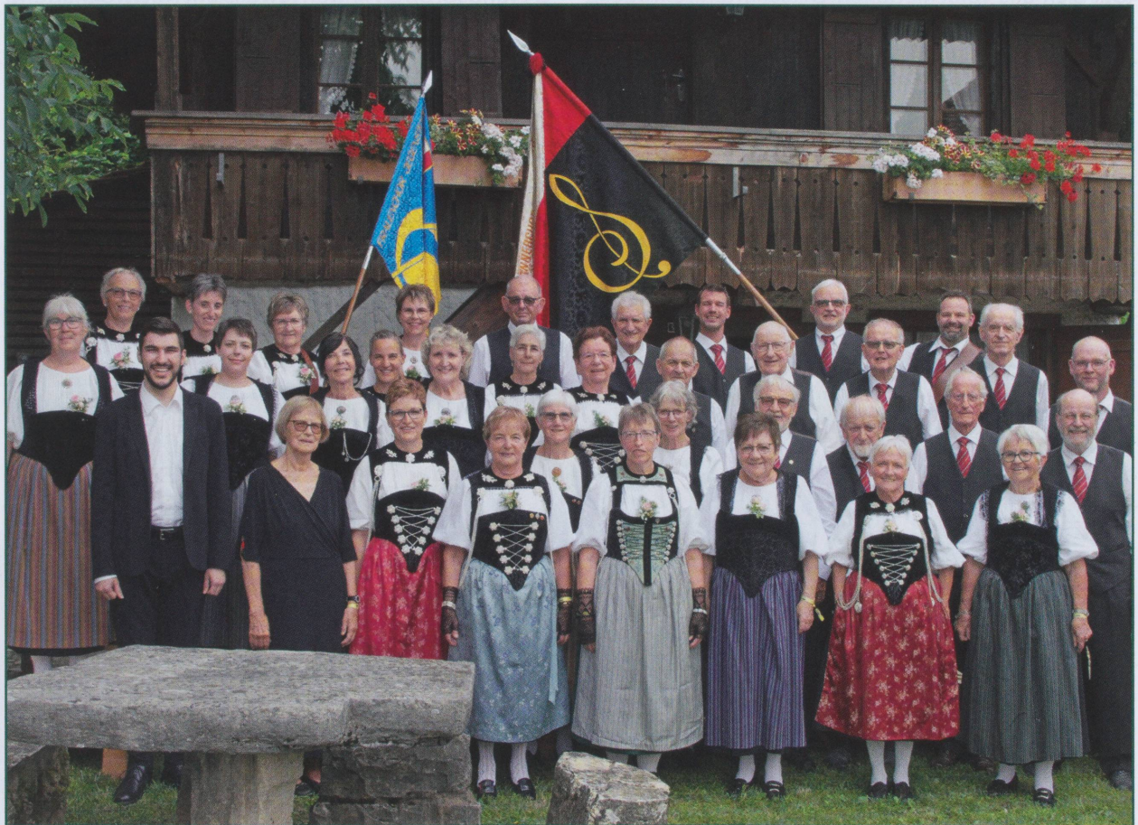
Jegischtorfer Singlüt am Sängertag 2024 in Safnern.