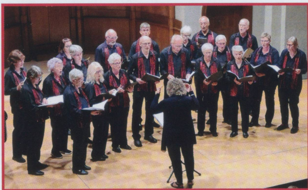
Gemischter Chor Erlenbach im Simmental

Gemischter Chor Erlenbach im Simmental Peter Wiedmer