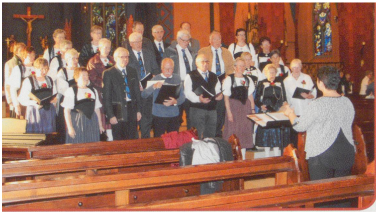
Gemischter Chor Zäziwil