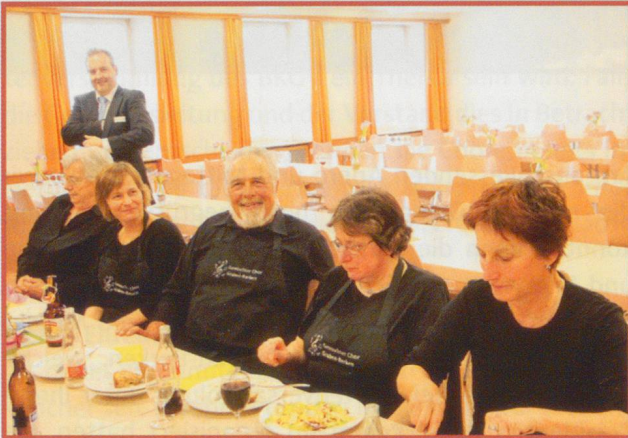
Der Gemischte Chor Graben-Berken beim verdienten Mittagessen