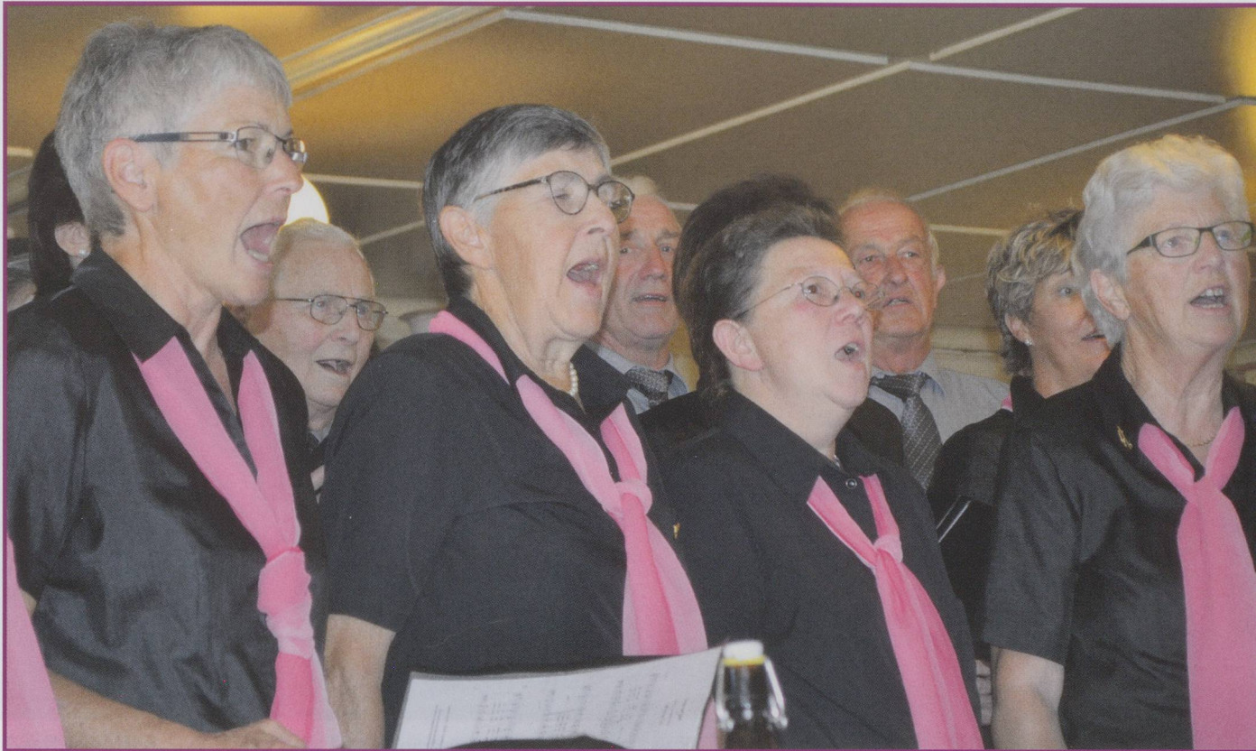
Gemischter Chor Trimstein.

macher und hat während des 2. Weltkrieges viele Soldatenlieder geschrieben. Später hat er aber vor allem die Schönheit der Welt besungen, so nannte man ihn auch «Minnesänger». Eines seiner bekanntesten Lieder heisst «Die Weise der Jahreszeiten», daraus zitiere ich die vierte Strophe: