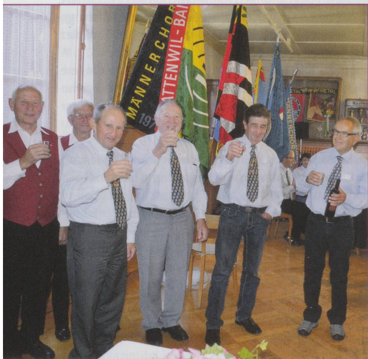
Gruppe 50+ Oberthal und Schlosswil.