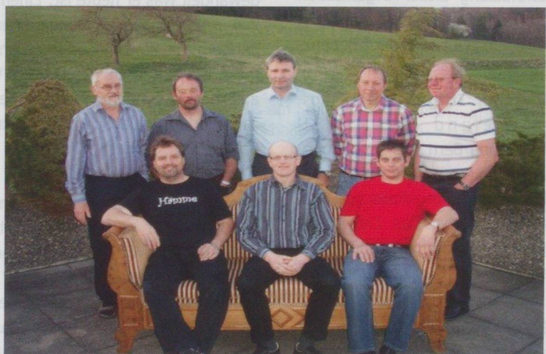
Das OK des Sängertages der CVRF 2012 in Limpach