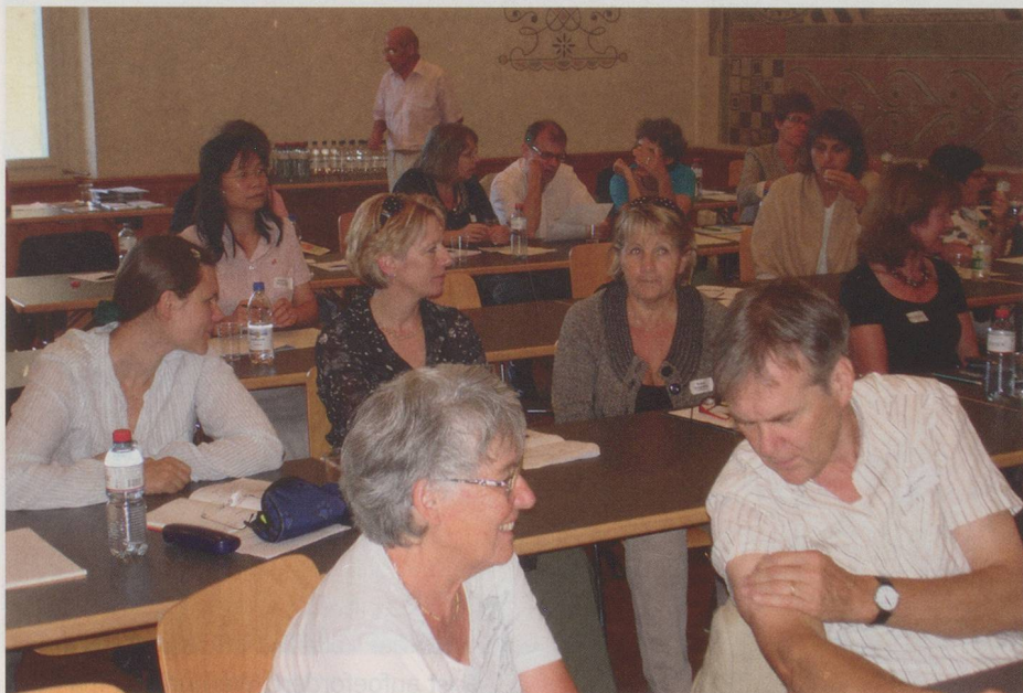
Angeregte Gespräche in der Pause

Über 30 Teilnehmer fanden an diesem wunderschönen Herbsttag den Weg an die Klausurtagung der Chorvereinigung Bern und Umgebung. Es hat sich gelohnt! Die Referenten überzeugten auf der ganzen Ebene mit ihren interessanten Ausführungen. Man hat viel gelernt und durfte wichtige Informationen, Anregungen und Ideen mit nach Hause nehmen. Ein gelungener Anlass, wo man zuhören, sich austauschen und die Freude am Chorgesang teilen konnte.