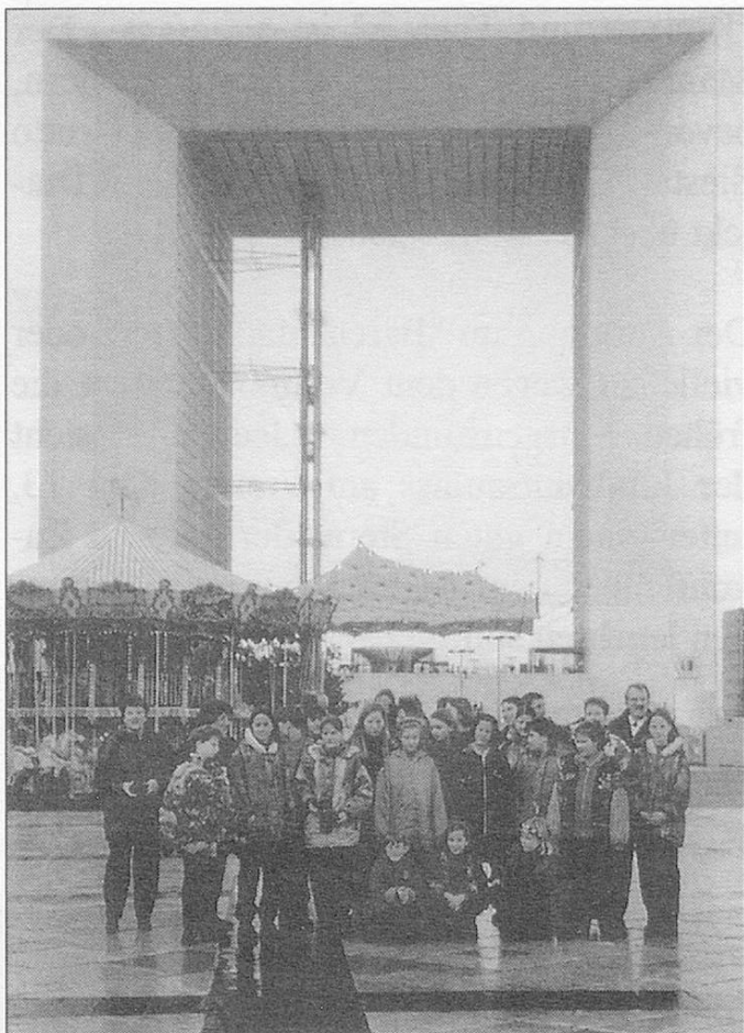
Der Kinderchor Rüeggisberg vor der Grande Arche de la Defence in Paris!

Im Januar 1998 fand in Paris ein Chor-treffen statt, zu dem wir auch eingeladen waren. Als unser Chorleiter uns davon erzählte waren alle total begeistert. Unser Problem war jedoch, dass wir die Reise nicht finanzieren konnten. Deshalb suchten wir Sponsoren. Die Aktion war ge-glückt.