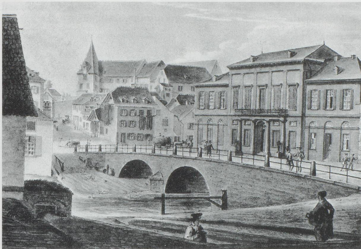
Abb. 1: Das Stadtcasino am Steinenberg.

Auch in Basel wurde die Musik unter den neuen gesellschaftlichen Verhältnissen zu einem erstrebenswerten Bildungsgut, und Konzerte, musikalische Kränzchen und Hausmusik erlebten eine erste Blüte. Konzertähnliche Veranstaltungen in halböffentlichem Rahmen, die – wie das Riggenbachsche Kränzchen – den Übergang zum öffentlichen Konzertleben anbahnten, lassen sich in Basel auch schon um die Mitte des 18. Jahrhunderts nachweisen, als gesellschaftlich bedeutende Kreise von Musikliebhabern private Musikkollegien gründeten. Ein exklusives Pendant zu den fürstlichen Hofkapellen des Auslands bildete zum Beispiel das „Blaue Haus“ am Rheinsprung, das Heim des Handelsherrn und Musikliebhabers Lucas Sarasin (1730–1802). Sarasin legte eine eigene Instrumenten- und Musikaliensammlung an und unterhielt ein Hausorchester, das in einem eigenen Musiksaal auftrat. Er selbst spielte dabei die Violine. Im „Blauen Haus“ musizierte sogar Kaiser Franz I. von Österreich, als er zu Beginn des Jahres 1814 beim Durchzug der Alliierten in Basel Halt machte.