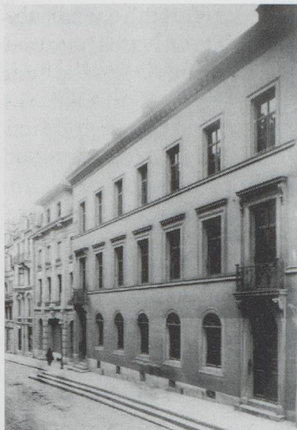
Abb. 6: Haus zum Kettenhof, Freie Strasse 113–115. Neu erbaut 1852, 1902 wegen Straßenerweiterung abgebrochen.

Im Kettenhof wurde also der Orpheus von Gluck zum ersten Mal nicht nur in Basel, sondern in der gesamten Schweiz vollständig zu Gehör gebracht – vor rund 80 Zuhörern in konzertanter Aufführung, und zwar „mit deutschem Text, aber nach der italienischen Bearbeitung des Componisten und mit Einschaltung des Schluss-Terzettes aus seiner französischen Original Composition“, 10 ein Ereignis, für das lange geprobt worden war. Weggelassen wurden nur solche Nummern, die in einer konzertanten Aufführung nicht umsetzbar waren, also etwa Ballette. Die Rolle der Eurydike wurde von August Walters Ehefrau Josephine Walter-Fastlinger gesungen, einer ausgebildeten Sopranistin, die Titelpartie von der Altistin Margaretha Riggensbach-Stehlin. Das Ehepaar Riggensbach-Stehlin lud so viele Gäste wie möglich ein und betrieb einen ungeheuren Aufwand, um beste Voraussetzungen für den Konzertabend zu schaffen. Die Zimmer im Kettenhof wurden umgeräumt, aus dem Stadtcasino wurden fast 80 Konzertsessel, mehrere Hänggerüste für die Garderobe der Gäste und diverse Lüster und Kandelaber zur Optimierung der Beleuchtung gemietet bzw. gekauft. 11 Nach vollbrachtem Werk vermerkte Friedrich Riggensbach in den Kränzchenannalen: