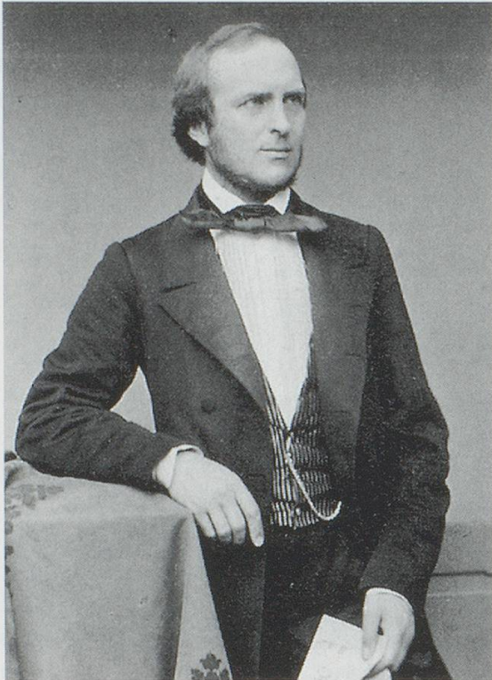
Abb. 2: Friedrich Riggenbach-Stehlin (1821–1904).

Blüte stehen würde und zu einem wichtigen Stimulans für die Entwicklung des Musiklebens einer ganzen Stadt werden sollte.