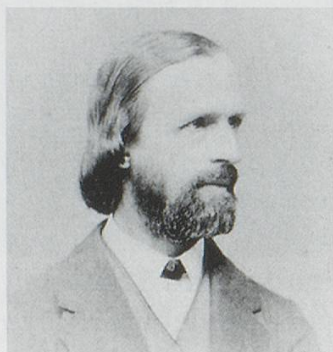
Abb. 5: August Walter (1821–1896)

Im Kränzchen musizierte man zum eigenen Genuss und aus Freude am gemischten Chorgesang, trat jedoch schon bald auch bei wichtigen Familienereignissen der Kränzchenangehörigen sowie bei Hauskonzerten im Haus der Familie Riggenbach auf und wirkte in August Walters öffentlichen Konzerten mit. Walter war seinerzeit einer der bedeutendsten Musiker in Basel, ganz besonders bedacht auf die Kenntnis und Pflege von Vokalmusik. Bis zu seinem Tode veranstaltete er alljährlich öffentliche Konzerte, in denen er zum Teil selbst als Pianist auftrat.