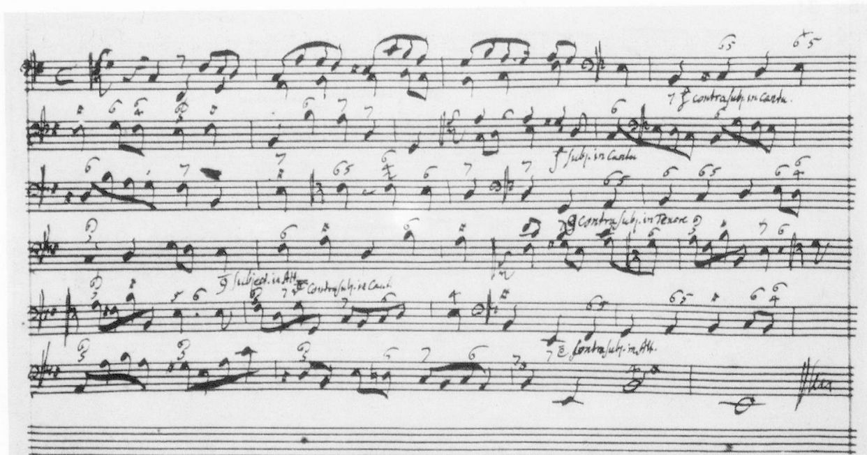
Bsp. 23: (nach: G. F. Händel, Aufzeichnungen zur Kompositionslehre , a.a.O., S. 50).

In den letzten beiden Aufgaben verlangt Händel schließlich einen Generalbaß-Satz in Doppelfugenexposition (Bsp. 23, 24). Es handelt sich um zwei Typen der Doppelthematik. Im ersten Fall sind die beiden Themen rhythmisch und melodisch klar voneinander unterschieden; im zweiten, komplizierteren, bezieht sich die Unterscheidung nur auf die Notenwerte, während die lineare Gestalt des Gegen-themas offensichtlich aus der des Hauptthemas entwickelt wird. Beide Aufgaben werden wieder durch Händels eigene Beispiele ergänzt (Bsp. 25, 26).