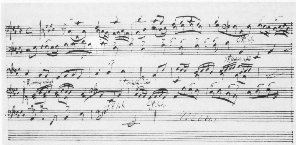
Bsp. 24: (nach: G. F. Händel, Aufzeichnungen zur Kompositionslehre , a.a.O., S. 51).

In den letzten beiden Aufgaben verlangt Händel schließlich einen Generalbaß-Satz in Doppelfugenexposition (Bsp. 23, 24). Es handelt sich um zwei Typen der Doppelthematik. Im ersten Fall sind die beiden Themen rhythmisch und melodisch klar voneinander unterschieden; im zweiten, komplizierteren, bezieht sich die Unterscheidung nur auf die Notenwerte, während die lineare Gestalt des Gegen-themas offensichtlich aus der des Hauptthemas entwickelt wird. Beide Aufgaben werden wieder durch Händels eigene Beispiele ergänzt (Bsp. 25, 26).