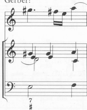
Bsp. 3: Gerber:

ist interessant, daß es Bach nur um den reinen Satz im Continuoart selbst zu tun war — wiederum ein Hinweis auf die Praxis der Zeit. Der Continuospieler hatte im allgemeinen eine bezifferte Baßstimme vor sich, keine Partitur. Bachs Anweisungen lassen daher die Führung der Obligatstimme außer Acht, aber die Stimmführung im Continuoart selbst ist unverkennbar die Bachs (Bsp. 3).