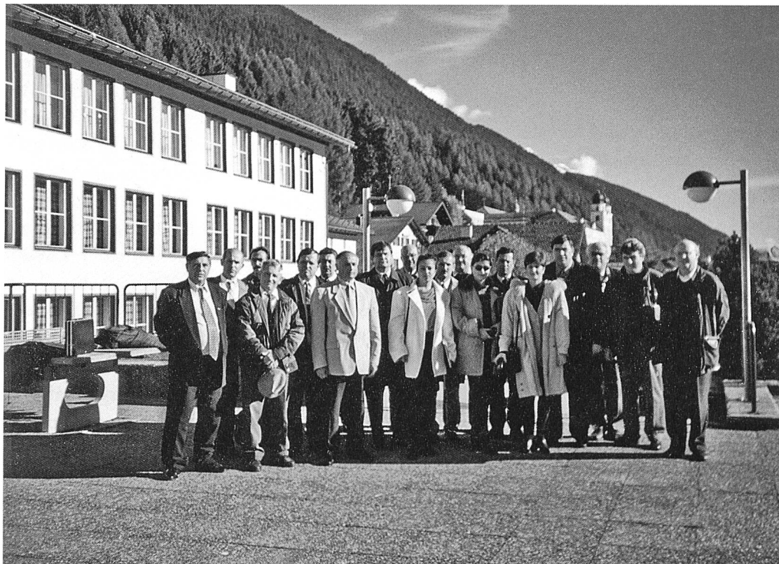
Demokratiemesinar in Chur mit rumänischen Bürgermeister, Ausflug nach Disentis 2005.