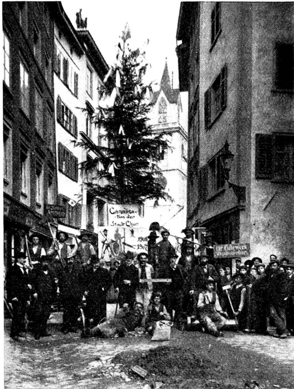
Die Erstellung der Kanalisation in den Jahren 1905-1907 erforderte namentlich in der Altstadt große bauliche Umtriebe.

Im Jahre 1922 hat auch die Feuerbestattung Eingang gefunden. Seit dieser Zeit haben 2112 Kremationen stattgefunden, wovon aber 1096 Auswärtige waren. Die Anlagekosten samt einem späteren elektrischen Ofen beliefen sich auf 380 000 Franken. Das Land gehört der Stadt; es ist das ehemalige «Totengut». Die bauliche Anlage ist Eigentum des Feuerbestattungsvereins. Die Kosten der Kremation waren in den ersten Jahren für Nichtmitglieder hoch; die Stadt zahlte nur 25 Franken Beitrag (die Erdbestattungen inklusive Sarg sind für Einwohner kostenlos). Jetzt bezahlt sie einen Beitrag von 70 Franken, an die Heizung 8 Fran-