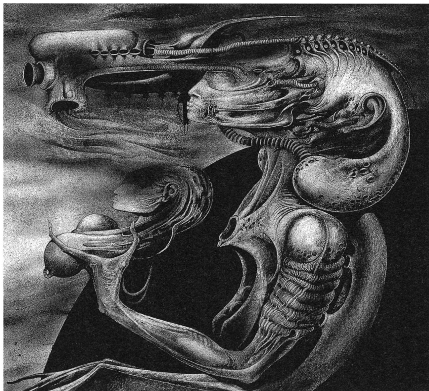
Frau mit Kind, 1967, Tusche auf Papier, 80 x 88 cm Musée HR Giger, Château St. Germain, Gruyères

Auf die makabren Tuschezeichnungen mit den Serien Strümpfe , Atomkinder und Ein Fressen für den Psychiater folgten die Nasszellen -Bilder, die Geburtstraumata und klaustrophobische Ängste in kalter, hyperrealistischer Präzision und in einer blauen Chromatik thematisieren. Die nüchterne Darstellung von ordinären Waschbecken oder Badewannen wirken aufgrund ihrer Isolierung und des apparatehaften Charakters der Dinge höchst beunruhigend. Die Werkgruppe Passagen zeigt in Nahsicht die Rückfront von Müllschluckern; die Fokussierung auf den unheimlichen Schlund und den mechanisch-hydraulischen Verschlussmechanismus löst ein Grauen mit erotischen Assoziationen aus. Neben den beklemmenden Schächten und den roten Hautlandschaften entstand das mit der Spritzpistolentechnik (Airbrush) geschaffene Ensemble der Biomechanoiden oder Humanoiden : Meist versehrte, fragile, zugleich hocherotische Frauenwesen, bei denen der Blick auf