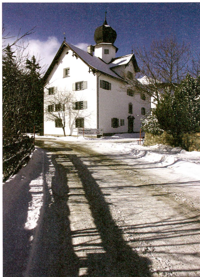
Das Schlössli in Parpan.

Dieser Charakterisierung möchte ich weitere Beobachtungen hinzufügen. Vorerst einige Charakteristika, die eher als Schwächen des nachgestaltenden Malers gelten müssen: Da ist die Art, Baumstämme so eigenartig zu verjüngen, dass sie fast den Charakter von Schläuchen bekommen. Unsicher ist Ardüser auch bei der Wiedergabe der