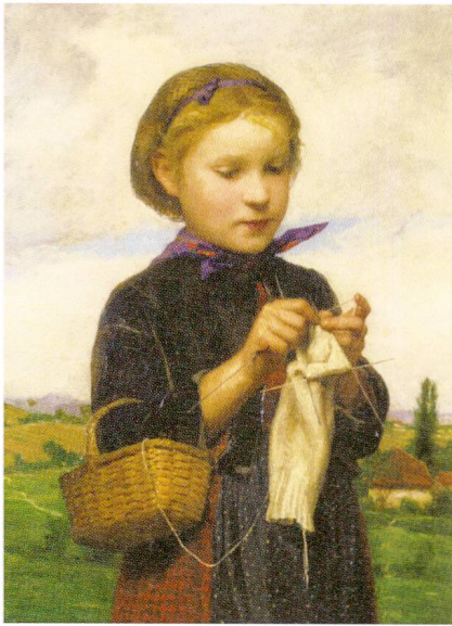
Albert Anker, Strickendes Mädchen in Landschaft, 1875.