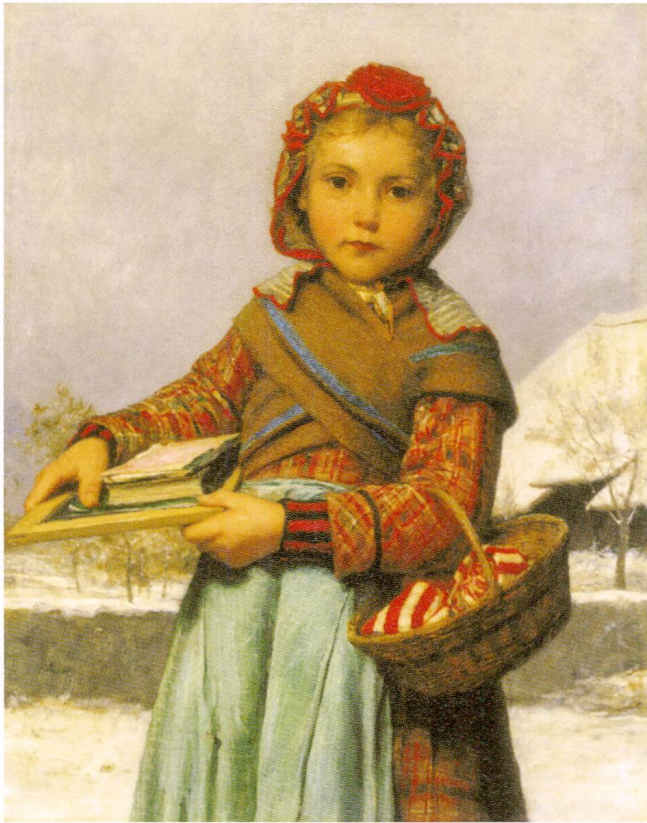
Albert Anker, Schulmädchen mit Schiefertafel und Nähkörbchen , 1878. (Quelle: Kunstmuseum Bern: Albert Anker, Bern 2010, 144)

behandeln. 8 Entsprechend gibt es – etwas zugespitzt formuliert – bei der in der Mitte des 18. Jahrhunderts einsetzenden Erziehungs-Ratgeberliteratur bis heute zwei Sorten von Büchern: Die allgemeinen Erziehungsratgeber und die Bücher zur Mädchenerziehung.