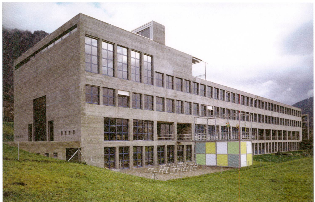
Frauenschule Chur, Januar 1995, heute Pädagogische Hochschule Graubünden.

Frauen sind zwar bevölkerungsmässig keine Minderheit, in vielen gesellschaftlichen Gremien und Organisationen aber sind sie es. 11 Sensibilität für die Situation von Minderheiten und die Berücksichtigung ihrer Anliegen war schon bei der Ausbildung der Handarbeits- und Hauswirtschafts-