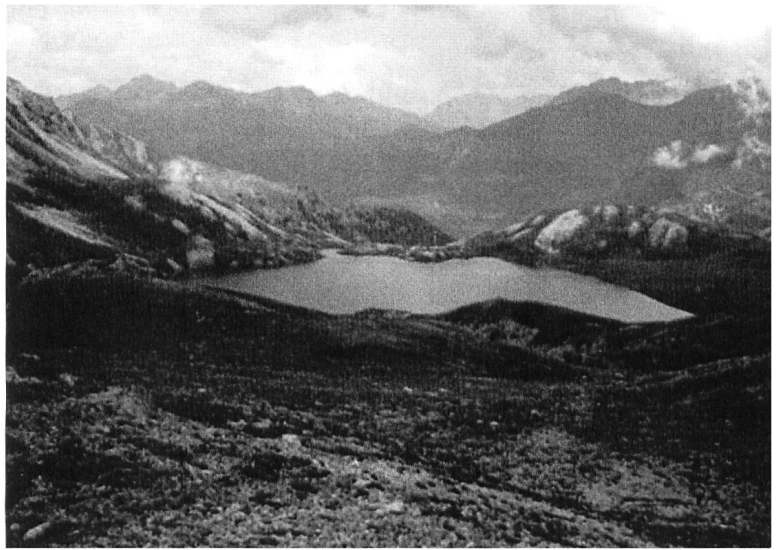
Lai da Rims (2396 m), Val Vau, Münstertal. (Quelle: Bundi 2009, 97)

In Poschiavo kennt man den Salvanch, in den Dolomiten die Salvans und Salvanel. Dass der «Uomo salvadego» auch im Veltlin sein Unwesen treibt, ist bei diesem Bündner Untertanenland gegeben. Beim längst bekannten Fresko aus dem veltlinischen Val dal Bitt (Sacco/Val Gerola) kommt der Wilde Mann wie ein manierlicher Italiener daher. Seine Gestalt ist kaum furchterregend, sein Blick der eines Alpenphilosophen, lediglich der mitgeführte Prügel und seine Devise lassen den Betrachter leicht erschauern.