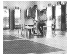
Parkett - Bodenbeläge