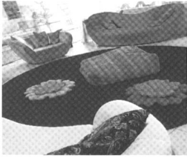
Junges, trendiges Wohnen