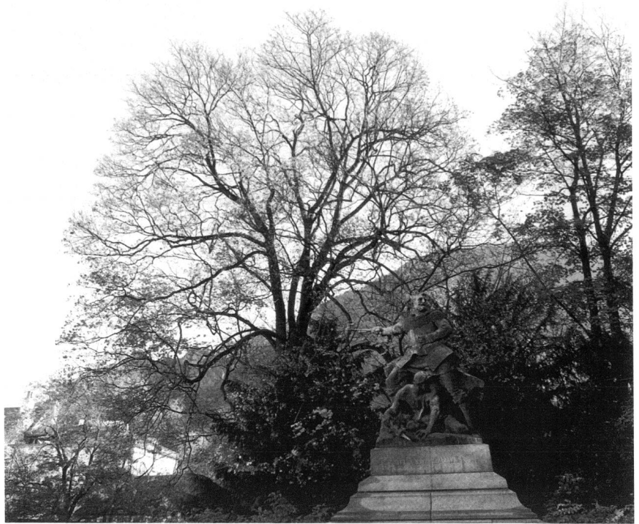
Der grosse Ahorn hinterm Fontana-Denkmal in Chur, vermutlich nach der Calven-Feier und zur Einweihung des Denkmals gepflanzt.

Schliessen wir diesen bei weitem nicht erschöpfenden Bericht über unsere mannigfaltigen Beziehungen zum Baum ab: Von der Verehrung in der Vorzeit für den Baum von übermenschlichem Wuchs und Alter bis zum Tröster und Bruder und dem Baum in Literatur, Kunst und Gesellschaft. Bei der Beschäftigung mit dem «Baum» bemerkt man aber in unseren Breiten leider auch, dass es die Bäume in unseren Städten schwer haben, sich zu behaupten, obwohl gelegentlich der eine oder andere Baum als seltsames Pflanzenwesen bestaunt wird, in Chur etwa der Ahorn hinterm Fontana-Denkmal, die gewaltige Blutbuche beim Grauen Haus oder die beiden riesigen Sequoia im Garten des Kunsthhauses. 31 Wir spüren vielleicht auch unsere Naturentfremdung, bei welcher Wälder, Berge, Gewässer gerade noch dem Sport und unserer Freizeitkultur zugute kommen.