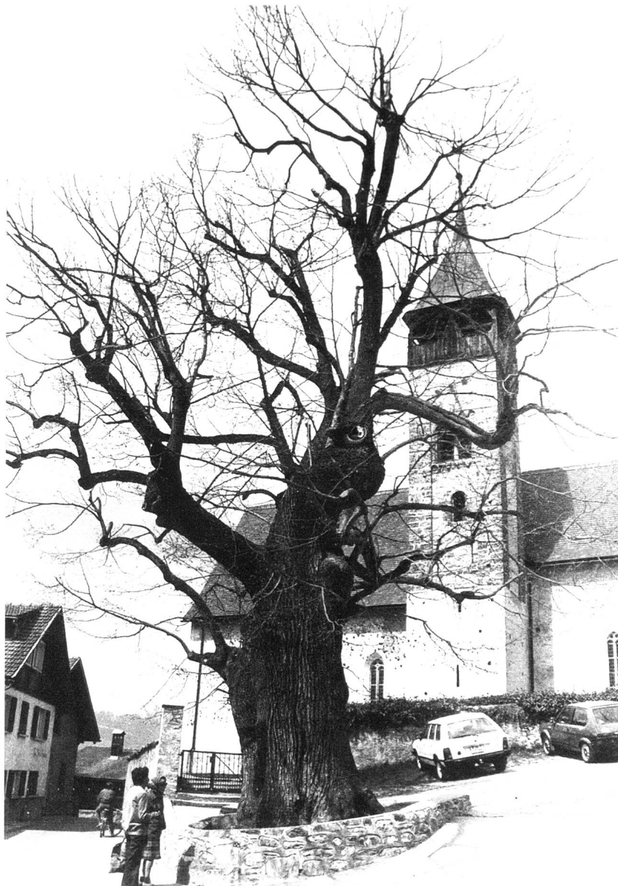
Linde vor der Kirche in Scharans.

Campells «Historia Raetica» (um 1575) ist über das Trunser Bündnis und seinen Baum zu lesen: «Er (der Graue Bund) wurde im Freien und unter den Zweigen eines Ahorns geschlossen, der noch heutzutage unverletzt stehen soll und nach dem Volksglauben so lange noch stehen wird, als man das Bündnis unverletzt hält. Ein Weghauen würde man verhängnisvoll für das Bündnis halten.» 29 In einer Fussnote bemerkt dazu der Übersetzer Conradin von Mohr: «Fast gänzlich erstorben, trieb er (der Baum) noch in diesem Jahre, 1851, einige grüne Blätter. Es werden wohl die letzten sein, oder der Baum überlebt sich selbst, weil in diesem Jahr nicht allein der Graue, sondern auch die beiden andern Bünde moderner Neuerungsucht zum Opfer fielen.» Fussnote zur Fussnote: C.V. Mohr spielt hier misstrauisch auf die neue Kreiseinteilung des Kantons an, die eben 1851 das selbstherrliche Leben der Drei Bünde und ihrer alten 48 Gerichtsgemeinden beendete. Karl Fry hat 1928 dem «Trunser Ahorn» eine liebevolle Monographie gewidmet und auch erzählt, welche Mühe man sich endlich mit dem altersschwachen Baum gab, dass der alte Strunk ins Rätische Museum kam und dass aus den noch gesunden Teilen Becher zum Verkauf geschnitzt wurden. Die Trauer beim Tode des alten Beschützers des Grauen Bundes und dass man bei der Trunser St. Anna-Kapelle für einen Ersatz sorgte, lassen erkennen, dass die alte mythische Beziehung zwischen dem Volk und